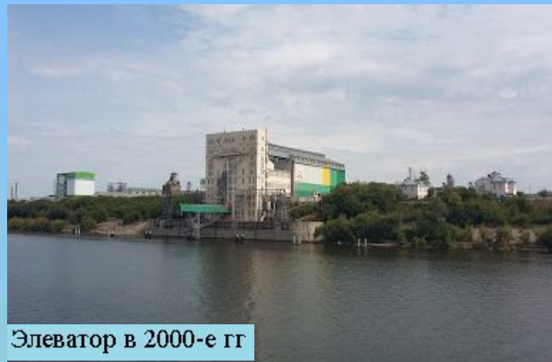
Элеватор в 2000-е гг