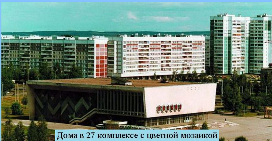
Дома в 27 комплексе с цветной мозаикой

На первом этапе, ускоряя решение проблемы жилья, архитекторы не придавали значения монотонности монохромных бело-серых фасадов крупнопанельных «коробок». В конце 1970-х годов появляется переломное для города решение Челнинского ОРП ЦНИИЭП жилища и ДСК — разнообразить цветовую гамму строящихся зданий. Для облицовки фасадов стали использовать цветную керамическую плитку, что породило множество вариантов цветовых решений. Ритмичное чередование тонов — красных, бирюзовых, синих — в массе светлой по колориту застройки украсило город и придало индивидуальность его микрорайонам.