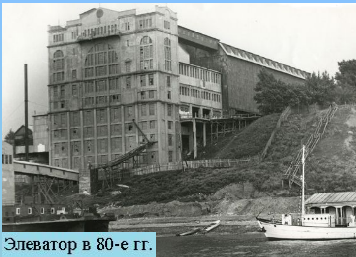
Элеватор в 80-е гг.

В начале XX века символом города, стал крупнейший в России речной элеватор, построенный под руководством иностранных фирм и специалистов, в 1914 — 1917 годах на средства государственного банка России. Данное сооружение является единственным сохранившимся в городе памятником промышленной архитектуры. В 2007 году Набережночелнинский элеватор был включён в государственный охранный реестр местного значения.