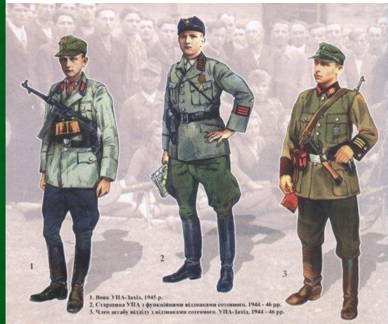
1. Вояк УПА-Захід, 1945 р. 2. Старшина УПА з функційними відзнаками сотенного, 1944 - 46 рр. 3. Член штабу відділу з відзнаками сотенного, УПА-Захід, 1944 - 46 рр.

Українська повстанська (повстанча) армія (УПА) — озброєне крило Організації українських націоналістів