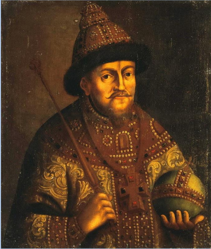
Портрет Михаила Федоровича Романова Эрмитаж