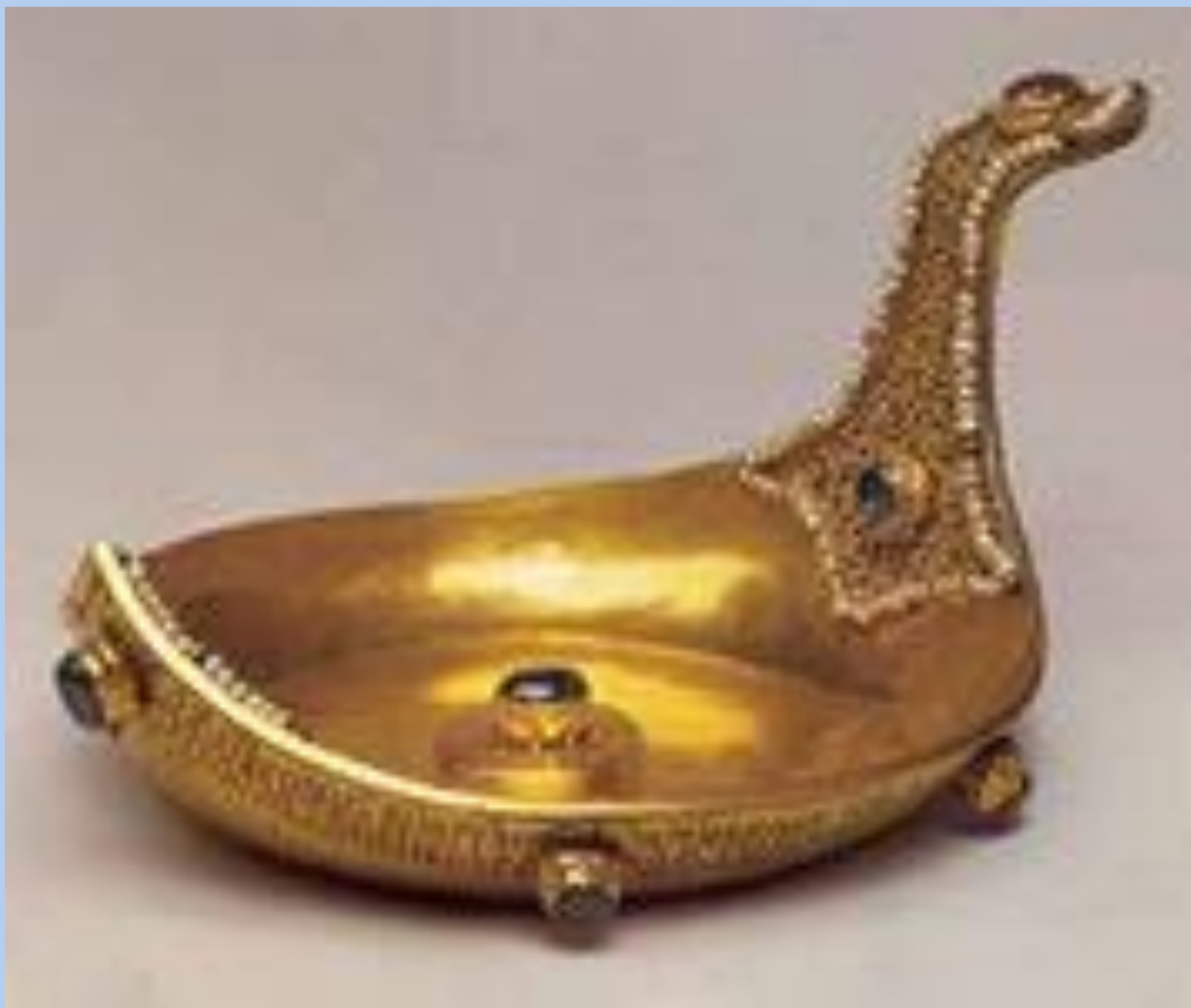
Ковш царя Михаила Федоровича. Мастерские Московского Кремля, 1618