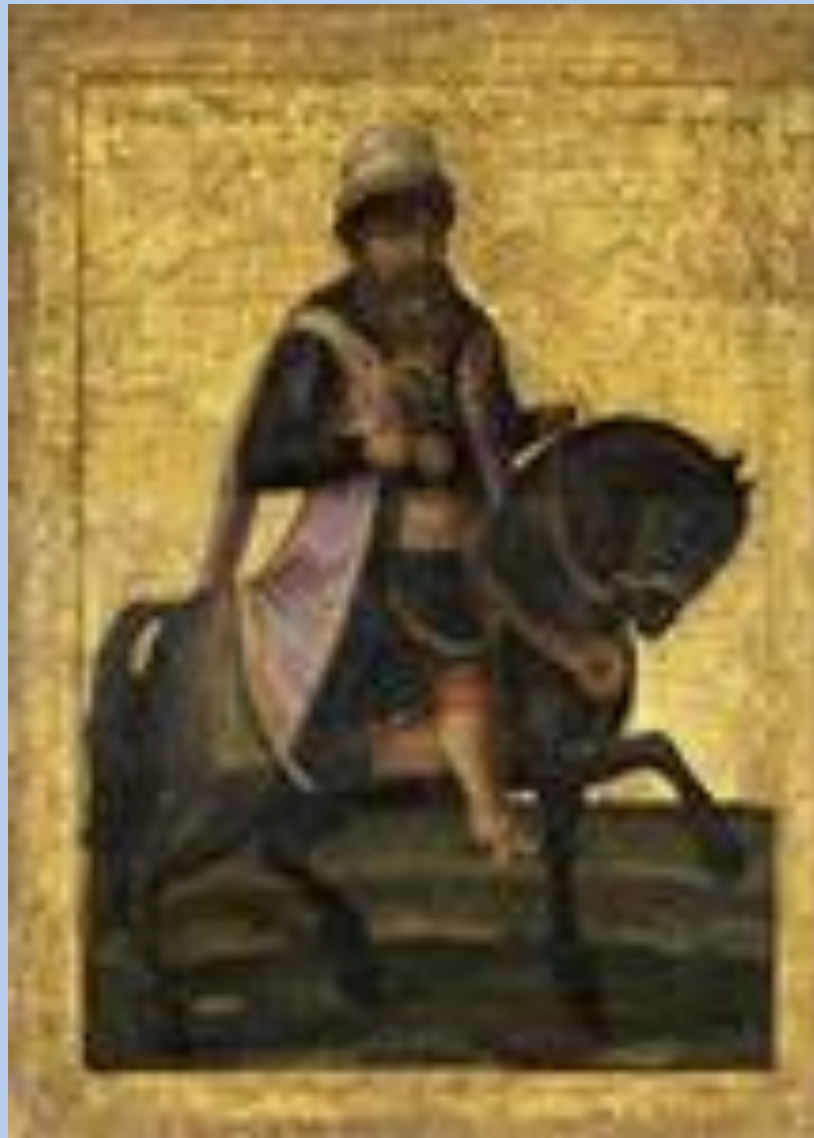
Парсуна "Царь Михаил Федорович на коне"; А. Рябушкин.