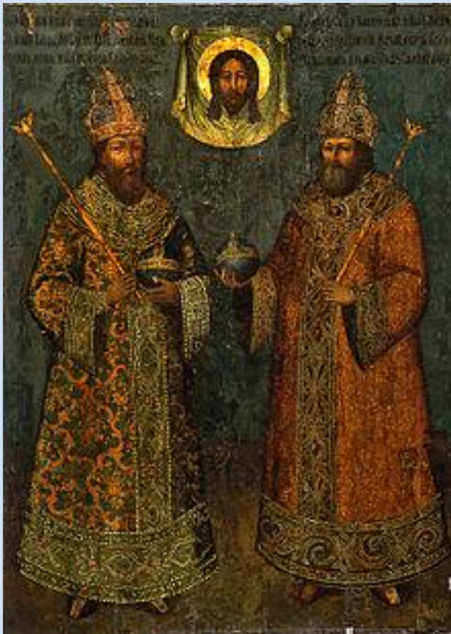
Федор Зубов. «Спас нерукотворный с предстоящими царями Михаилом Федоровичем и Алексеем Михайловичем»