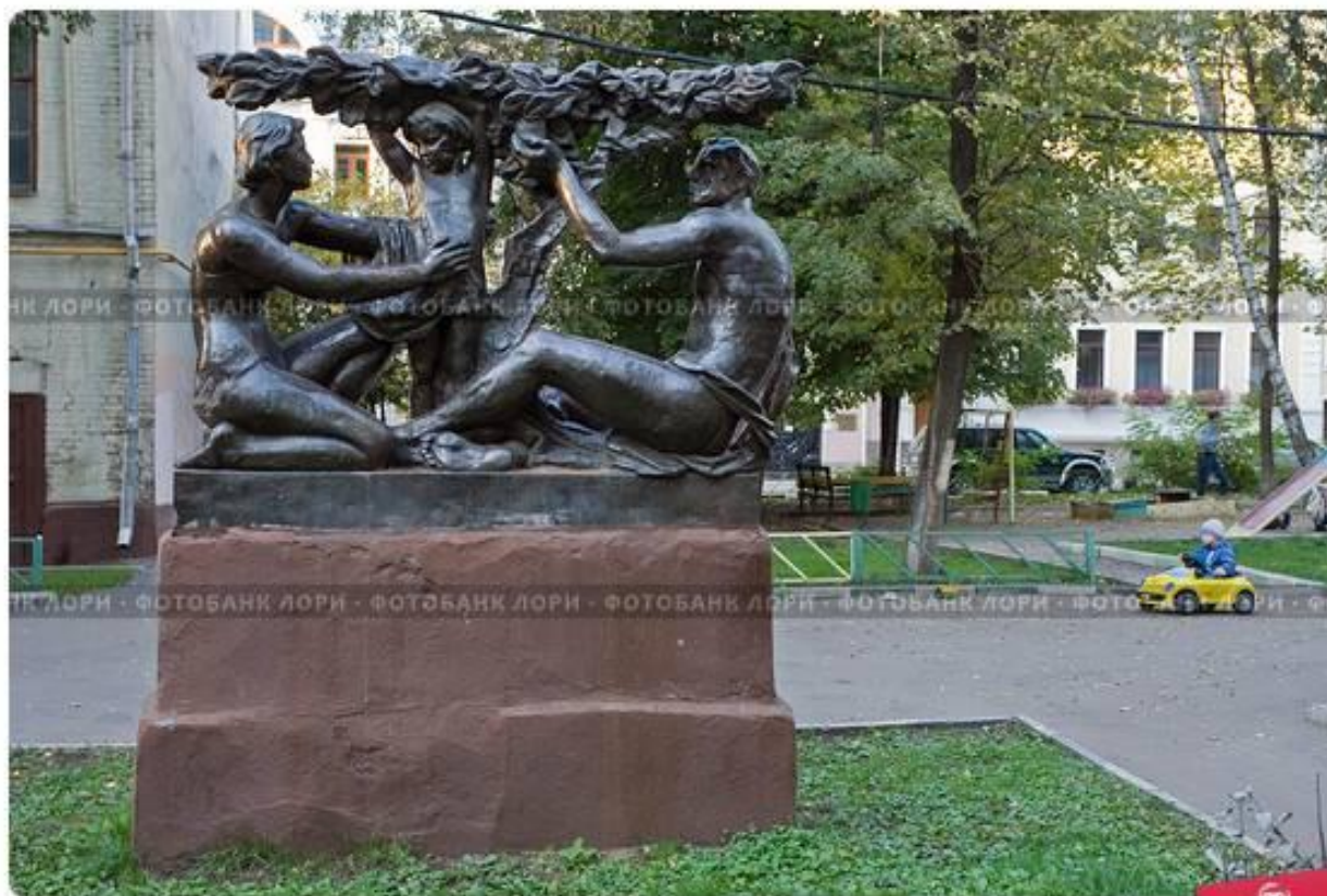
Памятник семье. Московский двор