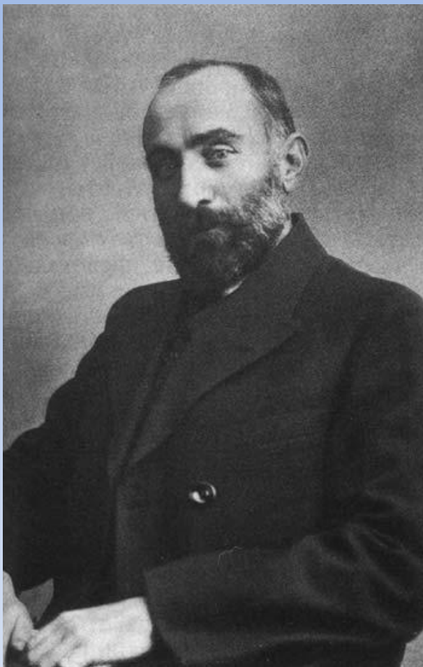
Чхеидзе Николай Семенович