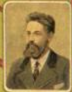
Министръ продовольственныхъ дѣлъ Г. Н. ЖУКОВСКИЙ.