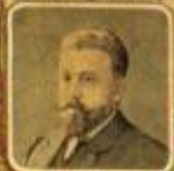
Министръ просвѣщенія С. С. ХОВРЯКОВЪ.