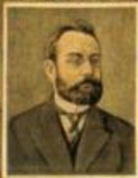
Министръ финансовъ В. Н. ЖУКОВСКИЙ.