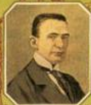
Министръ земледѣлія Н. С. КОРОТКИЙ.