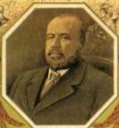
Министръ юстиціи Н. С. ФЕДОСЕЕВЪ.