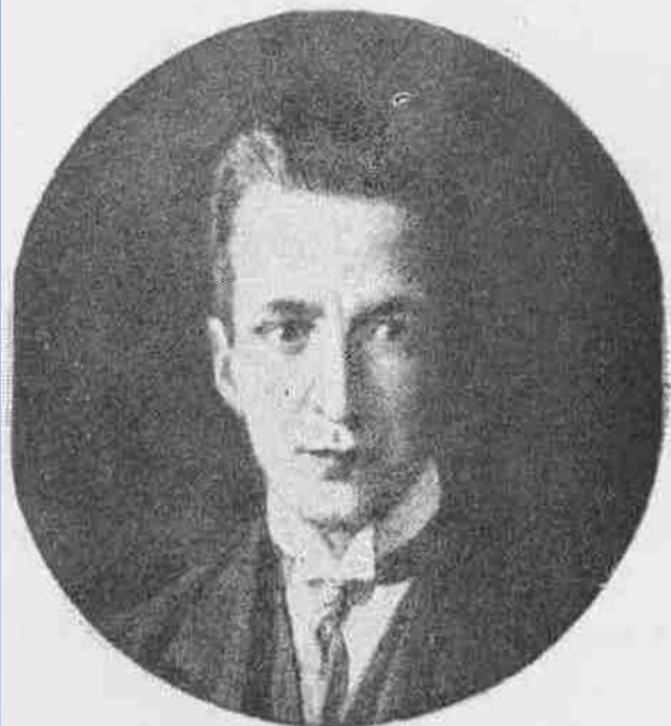
Лидер трудовиков, член партии социалистов-революционеров, Керенский