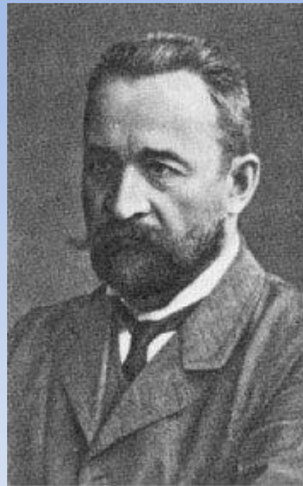
Львов Георгий Евгеньевич - князь, русский политик