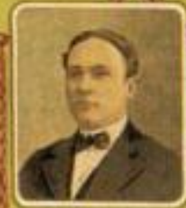
Министръ путей сообщения Н. С. ТРЕШНИКОВЪ.