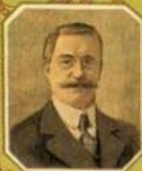
Министръ иностранныхъ дѣлъ Г. Н. ХАРЛАМОВЪ.