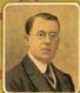
Министръ торговли и промышленности Г. Н. КИСЕЛЕВЪ.