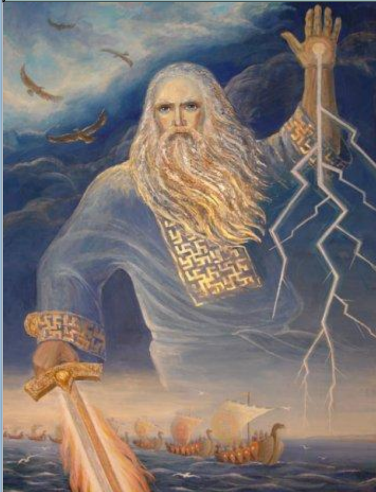
Перун – бог грома и молнии

бог-громовержец в славянской мифологии, покровитель князя и дружины. После распространения христианства на Руси многие элементы образа Перуна были перенесены на образ Ильи-пророка.