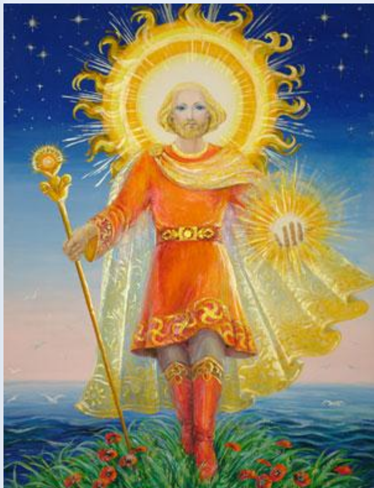
Ярило – бог Солнца

Идёт удалый бог, Ярило- молодец, И снежный саван рвёт по всей Руси широкой! Идёт могучий бог, враг смерти тусклоюкой, Ярило, жизни царь и властелин сердец, Из мака алого сплетён его венец, В руках — зелёной ржи трепещет сноп высокий, Глаза как жар горят, румянцем пышут щеки, Идёт весёлый бог, цветов и жатв отец!