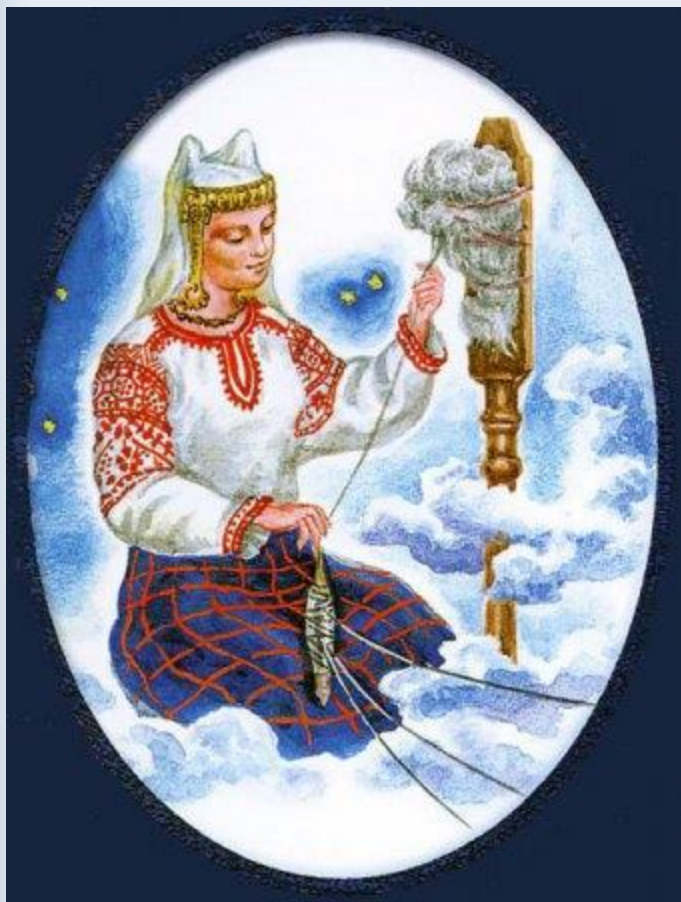
Мокошь ( Макошь)

Богиня в восточнославянской мифологии, единственное женское божество, идол которого стоял в воздвигнутом князем Владимиром киевском капище наравне с кумирами других богов