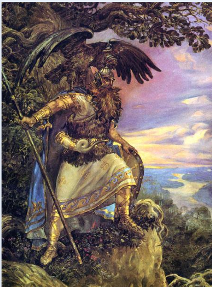
Перун – бог грома и МОЛНИИ

Великий князь Владимир Святославич поставил его во главе остальных богов и установил монумент рядом с княжеским дворцом в Киеве. После крещения Руси сам же велел его свергнуть и утопить в водах Днепра.