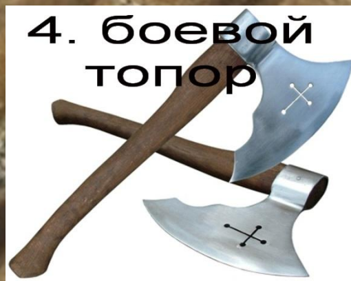
4. боевой топор