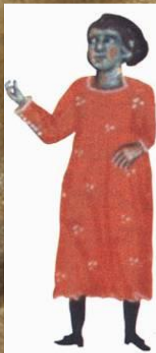
Серкамон – бедный гасконский жонглёр