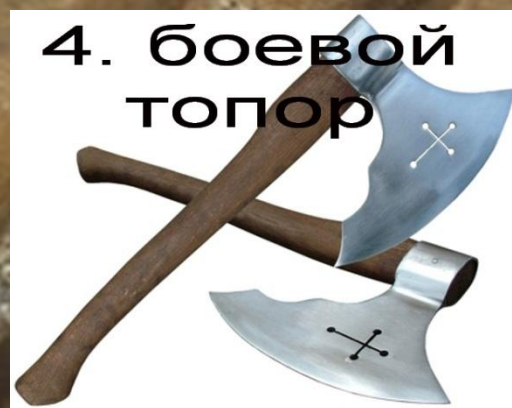
4. боевой топор