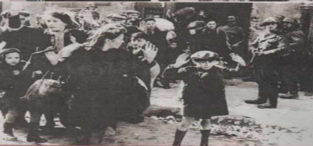
В Варшавском гетто