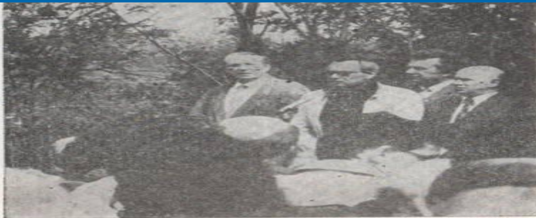
Пом Хашоа (1990 г.). Митинг-паніхіда в Дробицьком Яру.