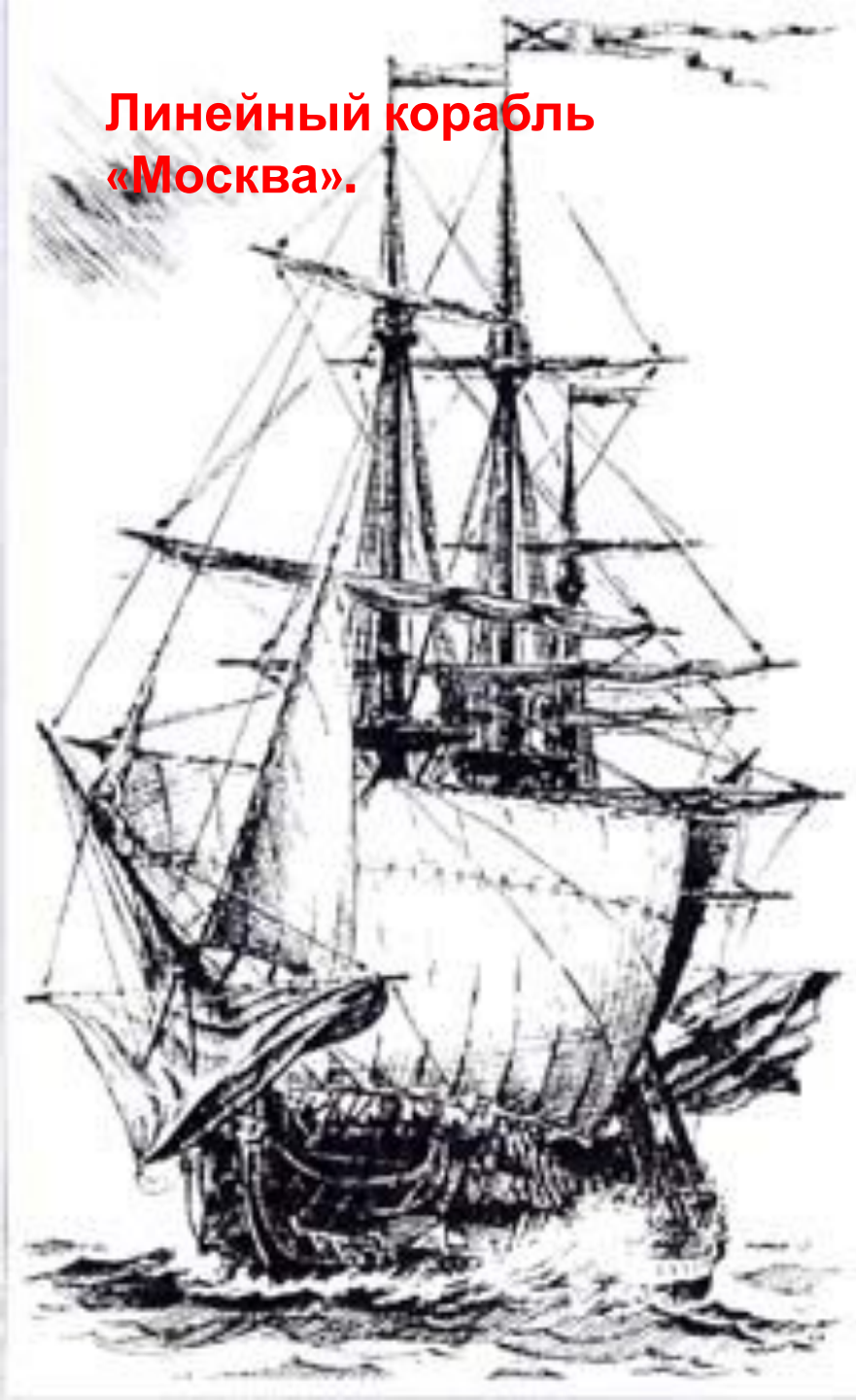
Линейный корабль «Москва».