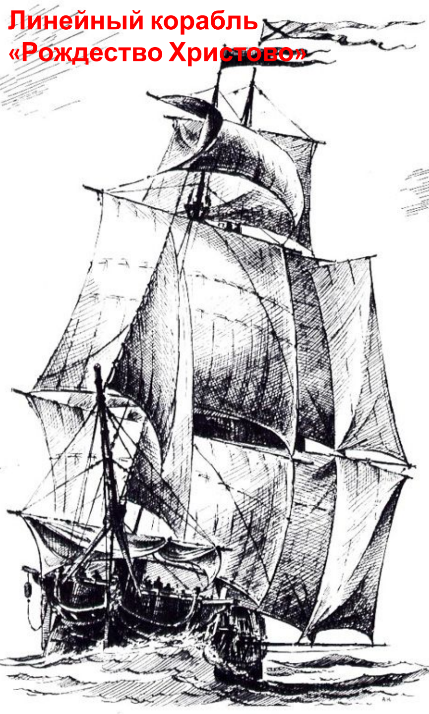
Линейный корабль «Рождество Христово»