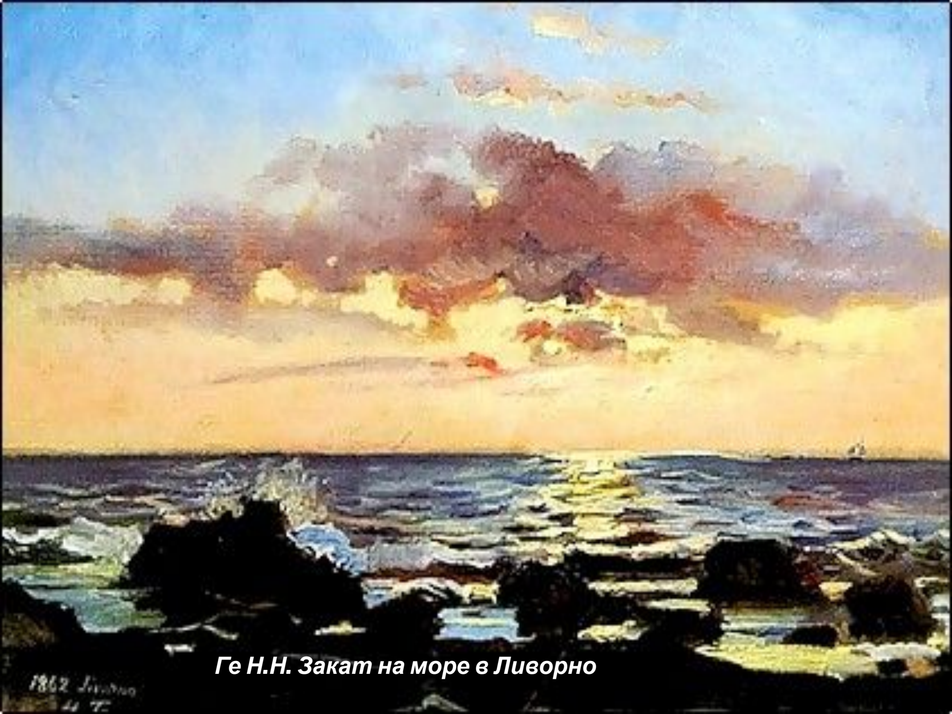
Ге Н.Н. Закат на море в Ливорно