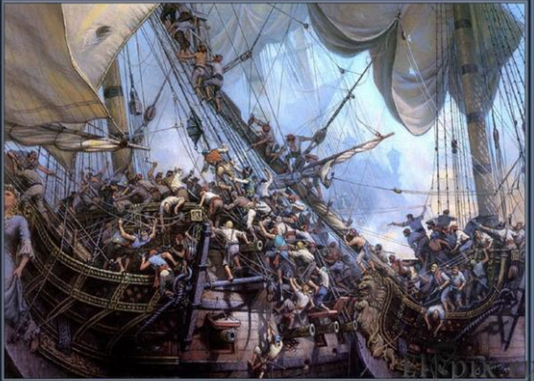
The Taking of the French Guinea-Man, 1717