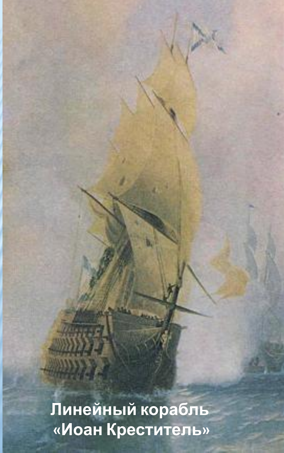
Линейный корабль «Иоан Креститель»