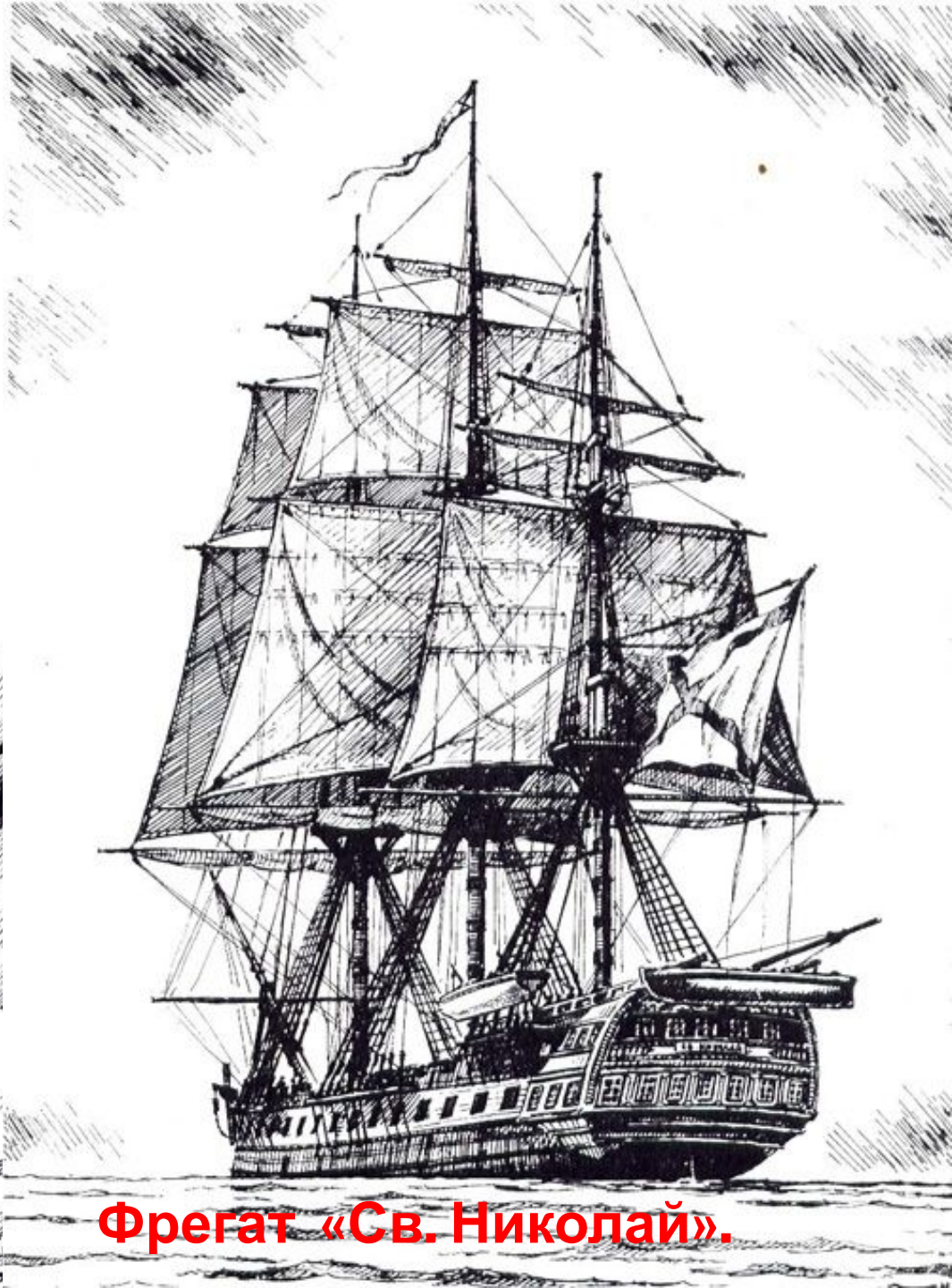
Фрегат «Св. Николай».