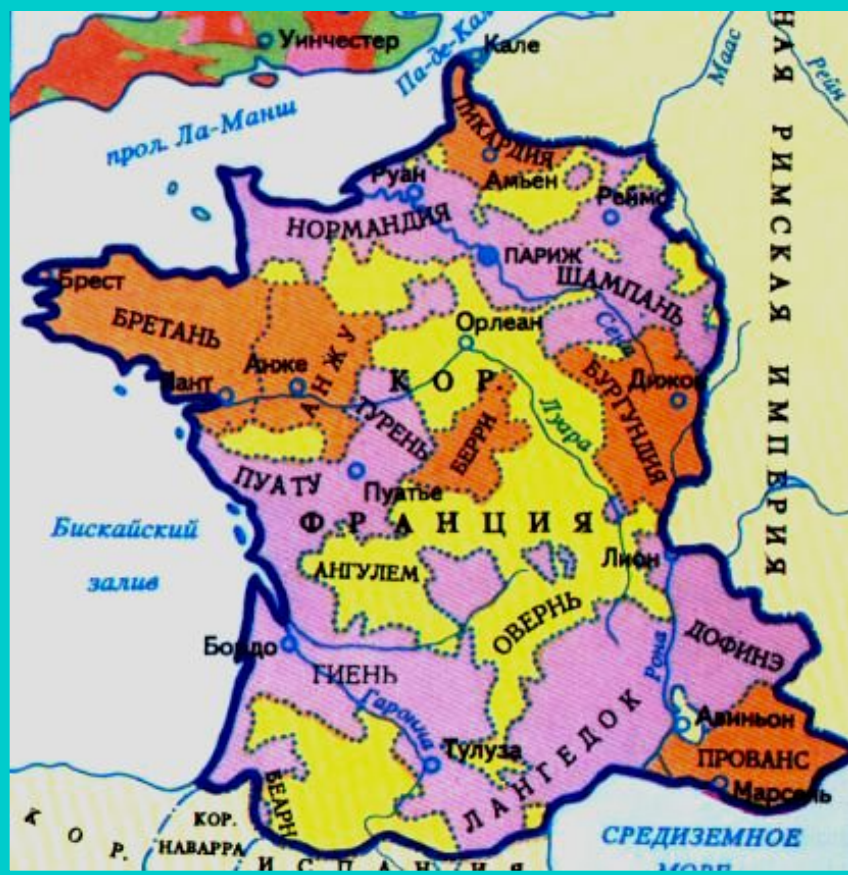
Франция в к.15 в.

Объединение страны привело к усилению королевской власти.