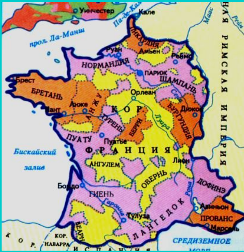
Франция в к.15 в.

Объединение страны привело к усилению королевской власти.