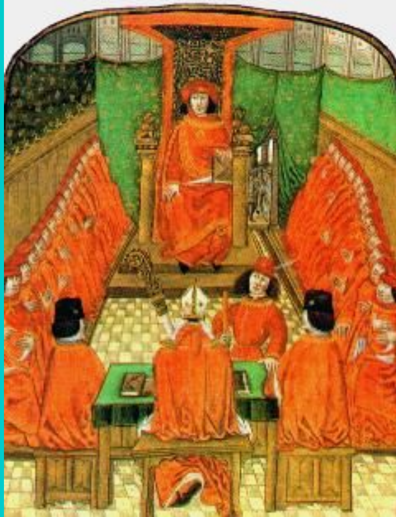
Орден «Золотого руна» бургундских герцогов.

Борьба короля и Карла продолжалась 12 лет. Король проиграл и заключил позорный мир.