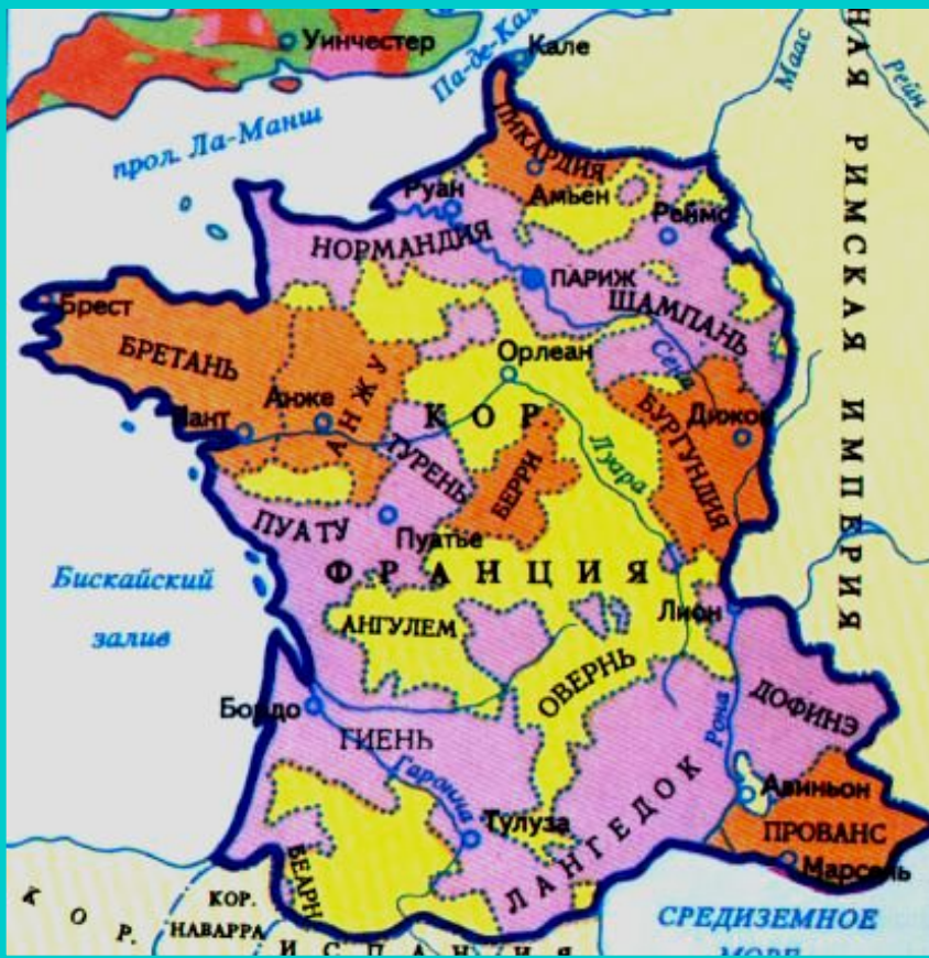
Франция в к.15 в.

Объединение страны привело к усилению королевской власти.