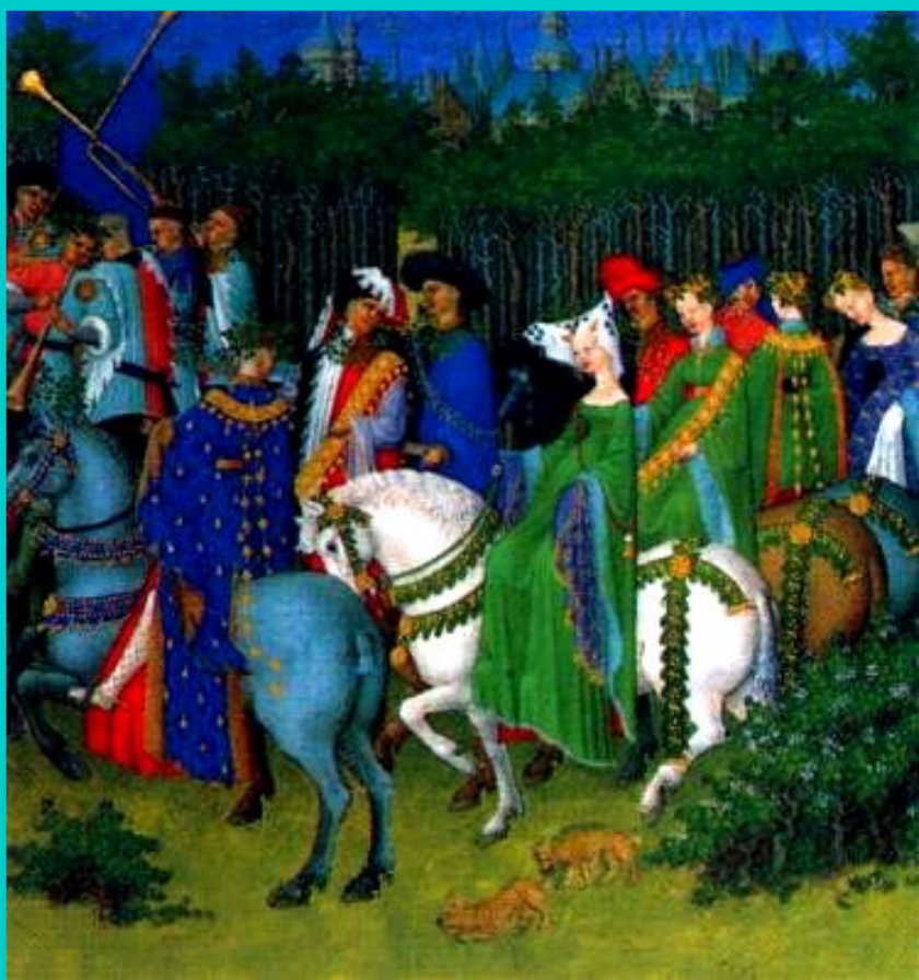
Плоды победы. Средневековая миниатюра.

Король ввел большие налоги на горожан и крестьян, зато прекратились набеги феодалов. Быстро развивалась торговля.