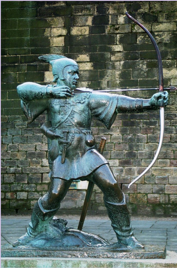
Памятник Робин Гуду в г. Ноттингем

Опираясь на горожан, рыцарей, духовенство, королевская власть победила в борьбе с крупными феодалами.