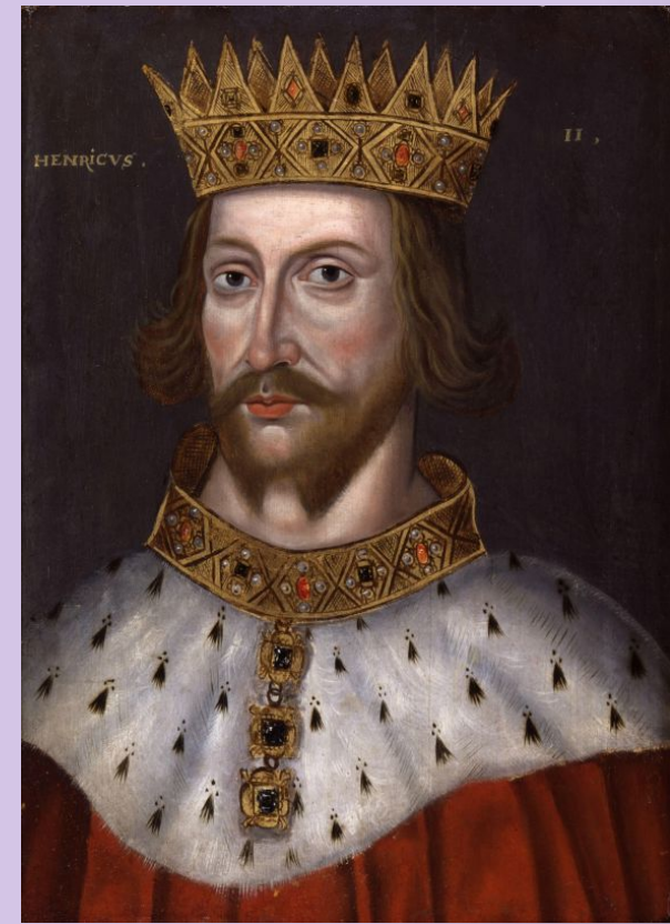
Генрих II Плантагенет