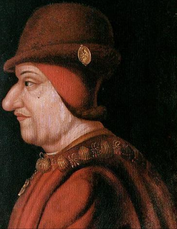
Людовик XI Благоразумный