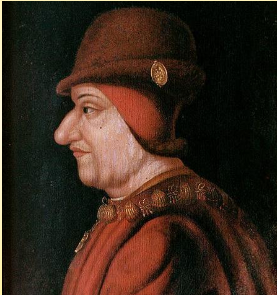
Людовик XI Благоразумный