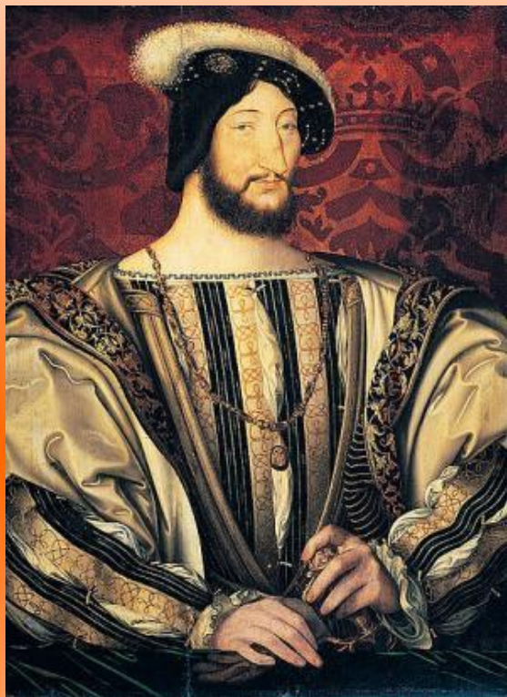
Франциск I Валуа

Во Франции абсолютная монархия начала складываться к XVI веку. Король Франциск I Валуа (1515-1547) единолично принимал все важнейшие решения, на своих указах он писал: «Ибо нам так угодно». Генеральные штаты во Франции не превратились в постоянно действующий орган, а собирались только в случае большой необходимости по решению короля. С 1614 до 1789 г. Генеральные штаты не собирались ни разу.