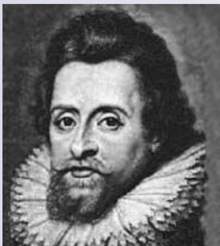
Яков I Стюарт, 1603-1625.