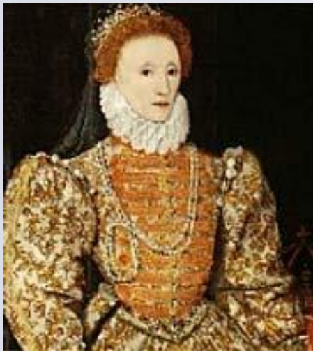
Английская королева Елизавета I Тюдор, 1566-1603.