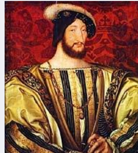
Франциск I, король Франции. 1515-1547.