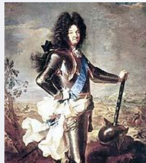
ЛЮДОВИК XIV Бурбон, 1643-1715.