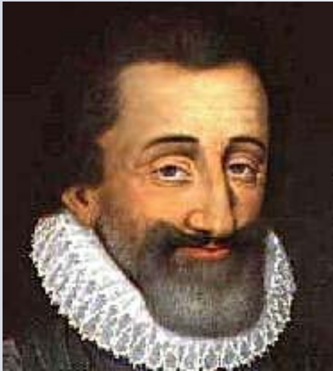
Французский король Генрих IV Бурбон.