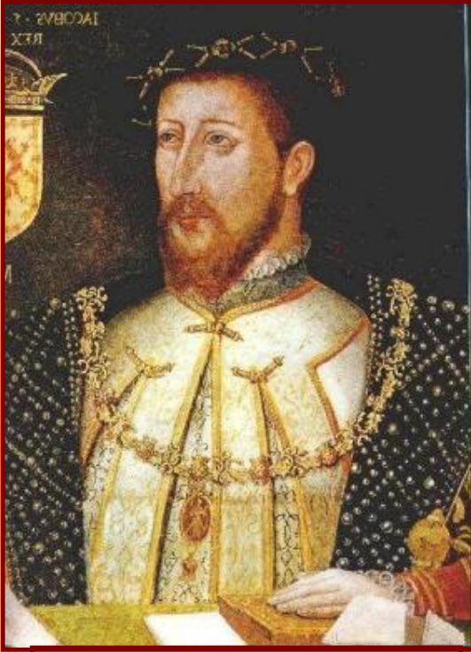
Яков I Стюарт

Вступивший на английский трон после Елизаветы Яков I Стюарт (1603-1625) в течение всего своего правления боролся с парламентом, всячески ограничивая его роль.