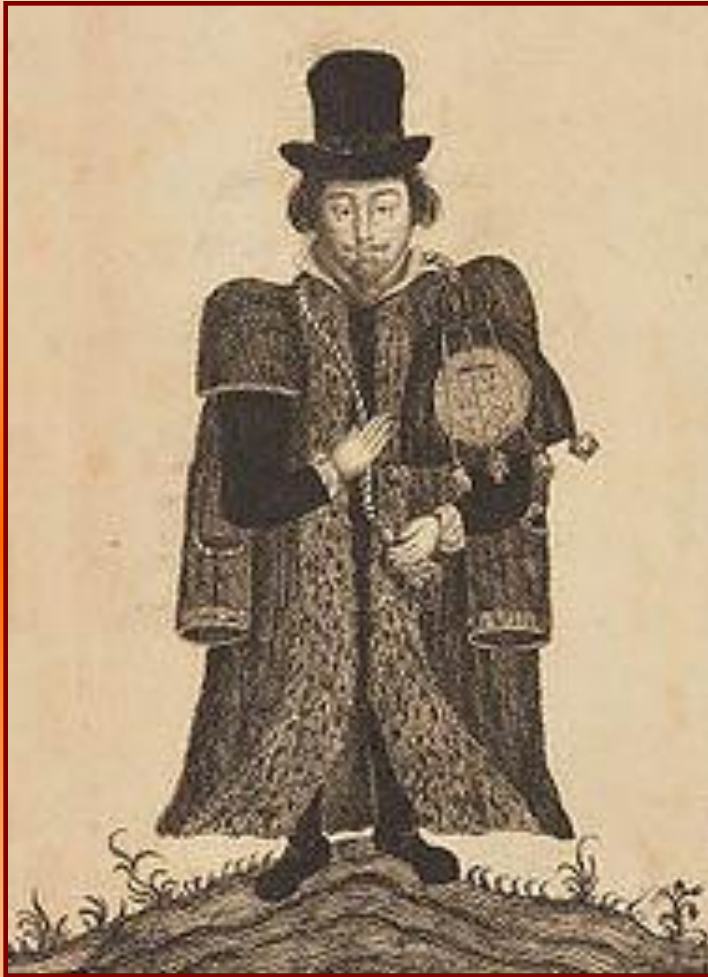
Английский юрист 16 в.

В Англии большая часть судебных дел велась двумя королевскими судами. За правосудием и мятежной знатью наблюдала Звездная палата. На местах существовали выборные мировые судьи (из старой аристократии и нового дворянства), но они избирались под контролем правительства и Тайного совета.