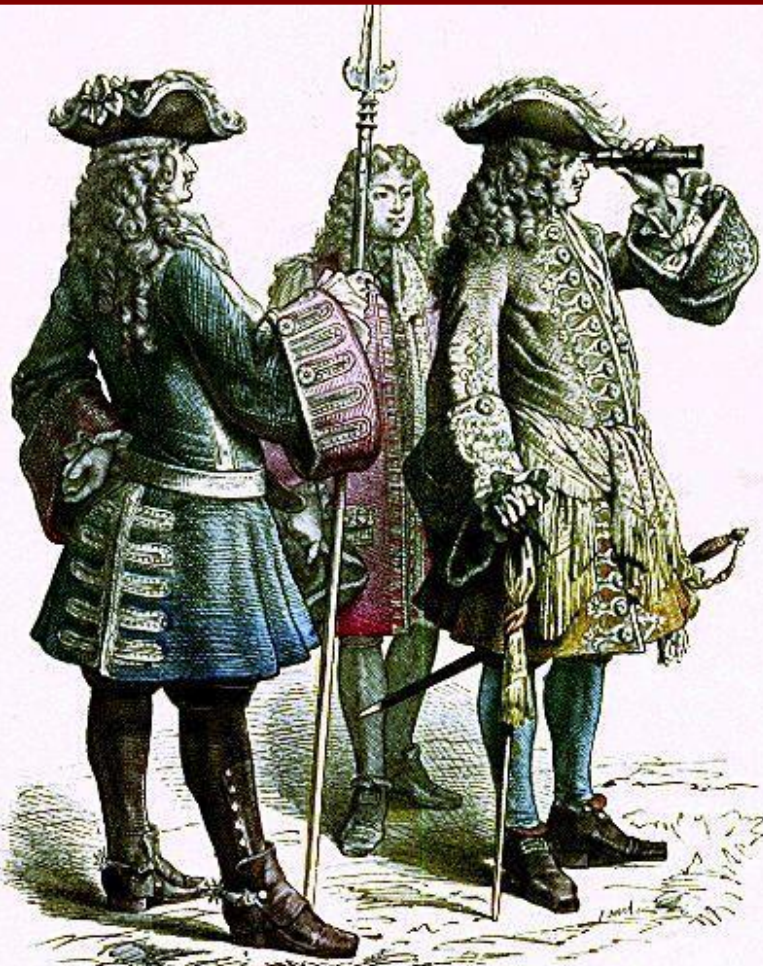
Französischer Marschall und Subaltern-Offizier.

Управление страной и в Англии и во Франции осуществляли чиновники. Должности чиновников передавались по наследству, покупались. Личные достоинства не играли роли – важно было наличие денег. Большинство чиновников не получало платы от государства, а жило за счет населения (подарки, подношения, взятки).