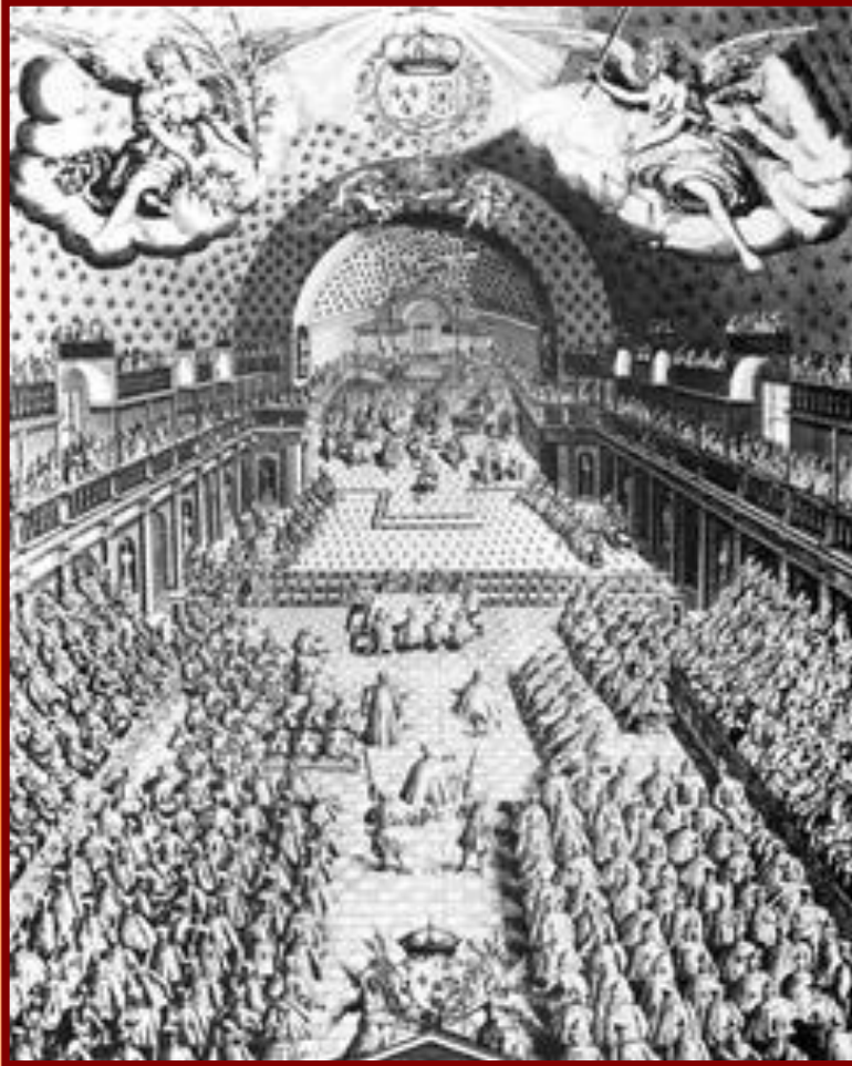
Французские Генеральные штаты в 1614 г.

В Англии центральным административным и исполнительным органом был Тайный совет, члены которого назначались королем. Во Франции при короле существовал совет, считавшийся правительством, но его члены также назначались королем и выполняли его волю. Членами этого правительства были принцы крови, высокие духовные чины, финансисты, юристы, но в стране было личное правление короля.