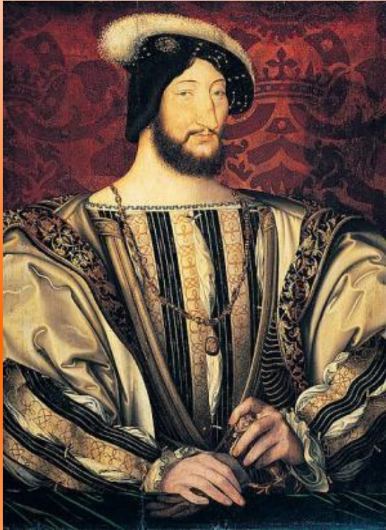
Франциск I Валуа

Во Франции абсолютная монархия начала складываться к XVI веку. Король Франциск I Валуа (1515-1547) единолично принимал все важнейшие решения, на своих указах он писал: «Ибо нам так угодно». Генеральные штаты во Франции не превратились в постоянно действующий орган, а собирались только в случае большой необходимости по решению короля. С 1614 до 1789 г. Генеральные штаты не собирались ни разу.