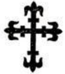
Крест, форма которого сложна