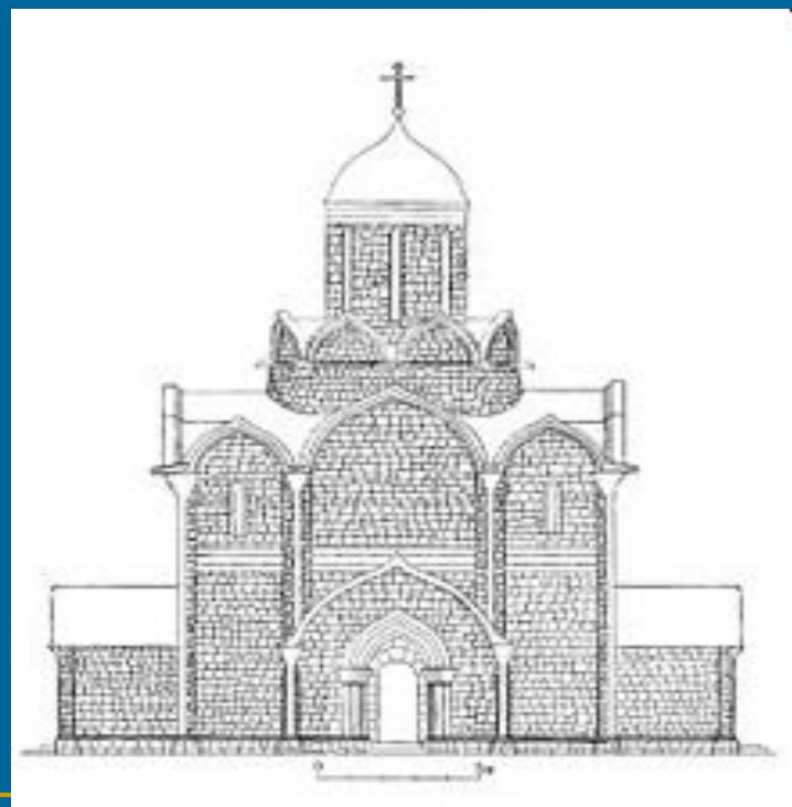
Успенский собор Ивана Калиты. Реконструкция С. В. Заграевского

«Если ты, — сказал святитель великому князю, — успокоишь старость мою и возведешь здесь храм Богоматери, то будешь славнее всех иных князей, и род твой возвеличится, кости мои останутся в сем граде, святители захотят обитать в оном, и руки его взыдут на плечи врагов наших»