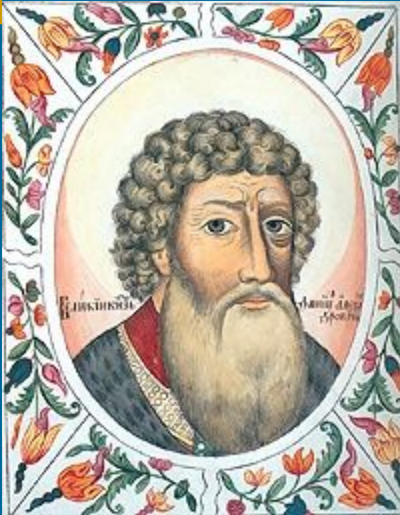
Миниатюра из Царского титулярника Князь московский

При основателе дома московских князей Данииле княжество занимало очень маленькую территорию, ограниченную бассейном реки Москва, и не имело выхода к Оке. В 1301 году Даниил разбил рязанского князя Константина Романовича, взял его в плен и захватил город Коломну . В 1302 году Даниилу удалось получить выморочный Переславль-Залесский , по завещанию своего бездетного племянника Ивана Дмитриевича (своего рода ключ к Владимиру)