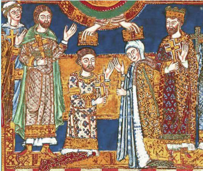
Генрих Лев и Матильда

Походы против славян, живших в нижнем течении Эльбы, возглавил герцог Саксонии и Баварии Генрих Лев из рода Вельфов. Он смог присоединить земли славян у Балтийского побережья и основал город Любек.