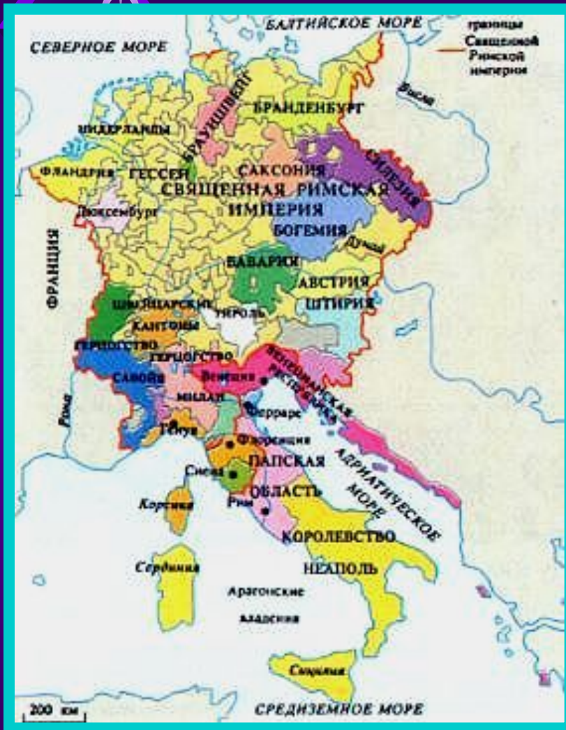
Священная римская империя в 15 в.

В XV в престол захватила австрийская династия Габсбургов.