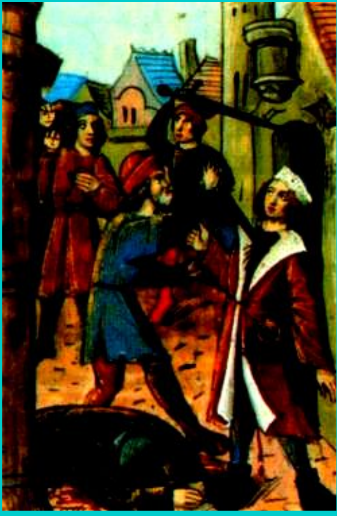
Заговор. Миниатюра 15 в.

Его соперником был Альбрехт Медведь. Он захватил земли полабских славян по течению Эльбы.