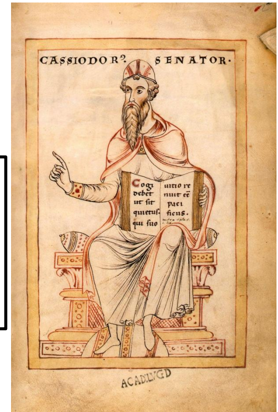
Кассиодор (ок. 490-583)

Наиболее известное его сочинение – «История готов». Огромной заслугой Кассиодора стало основание Виварийского монастыря, который стал крупным центром учености и хранилищем сочинений античных авторов