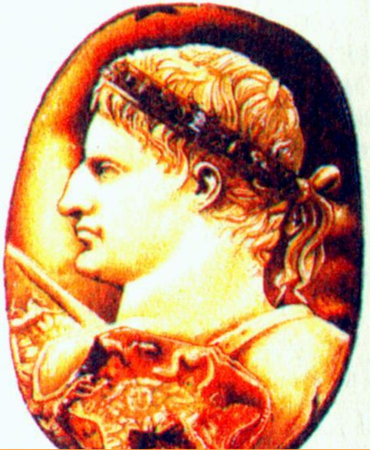
Октавиан. Древнеримская камея.

Октавиан, обвинял соперника в разбазаривании земель, которые тот дарил жене и дочерям.