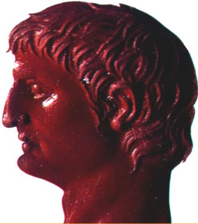
Марк Антоний. Древнеримский барельеф.

Убийство Цезаря в Риме восприняли неоднознач- но.