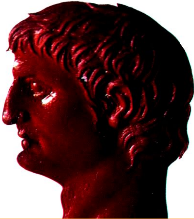
Марк Антоний. Древнеримский барельеф.

Убийство Цезаря в Риме восприняли неоднозначно.