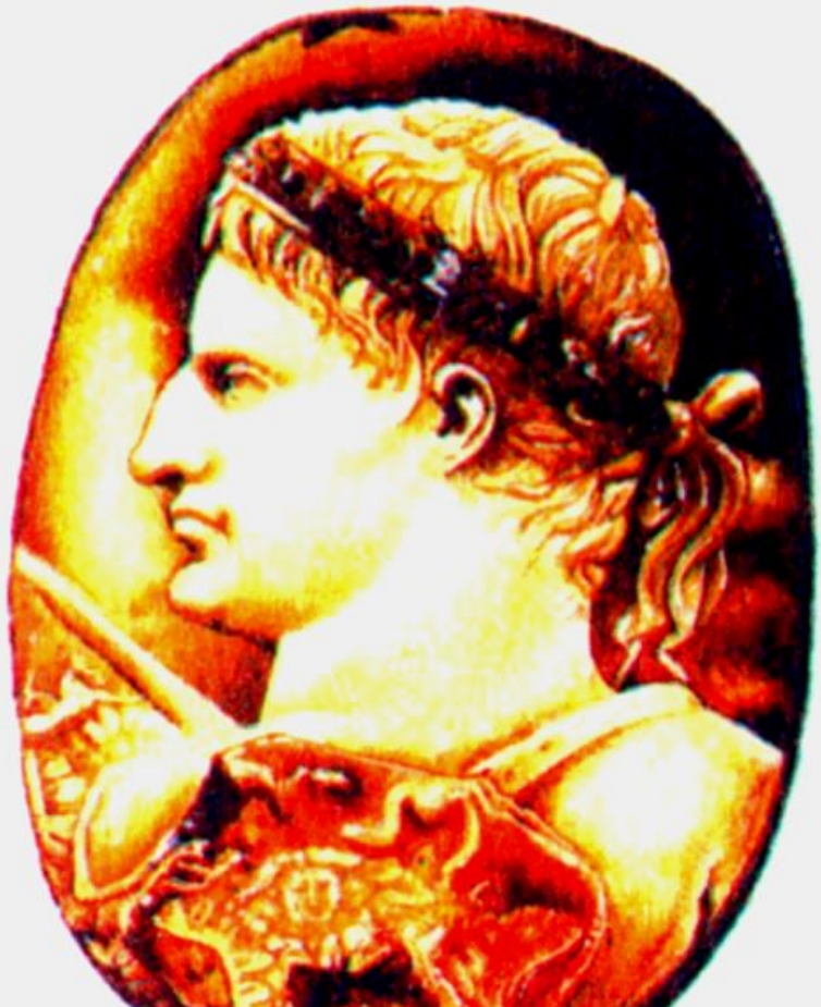
Октавиан. Древнеримская камея.

Октавиан, обвинял соперника в разбазаривании земель, которые тот дарил жене и дочерям.