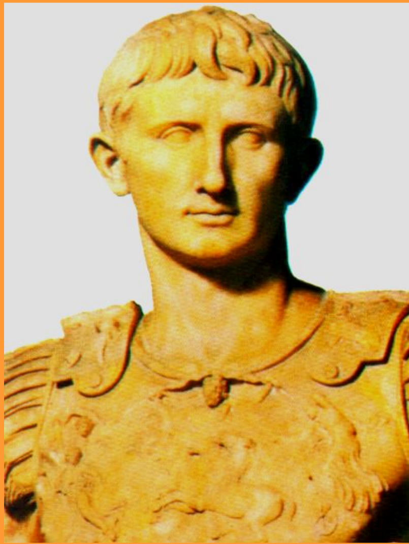
Октавиан Август- Император.

В 30 г до н.э. Октавиан объявил об окончании гражданских войн. Сенат присвоил ему почетное прозвище-Август (священный). Также вскоре стали называть один из месяцев римского календаря.