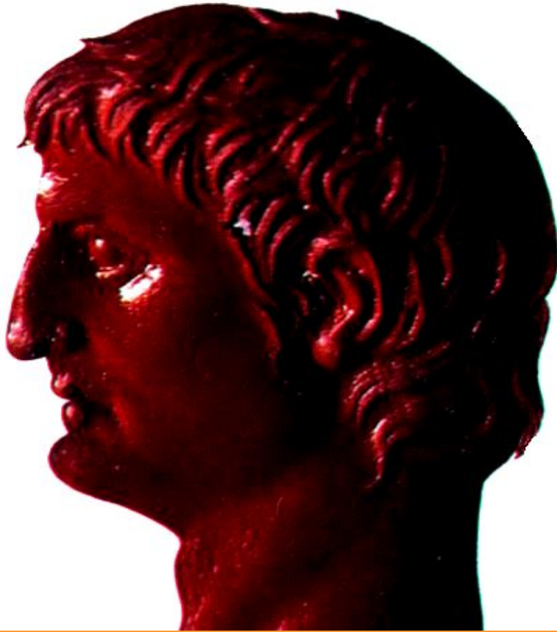
Марк Антоний. Древнеримский барельеф.

Убийство Цезаря в Риме восприняли неоднозначно.