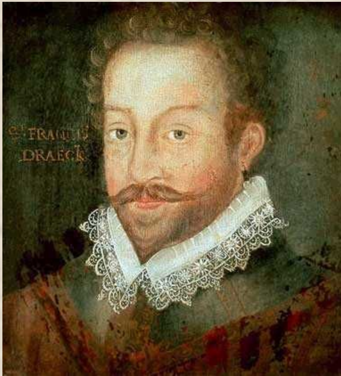
Адмирал Френсис Дрейк