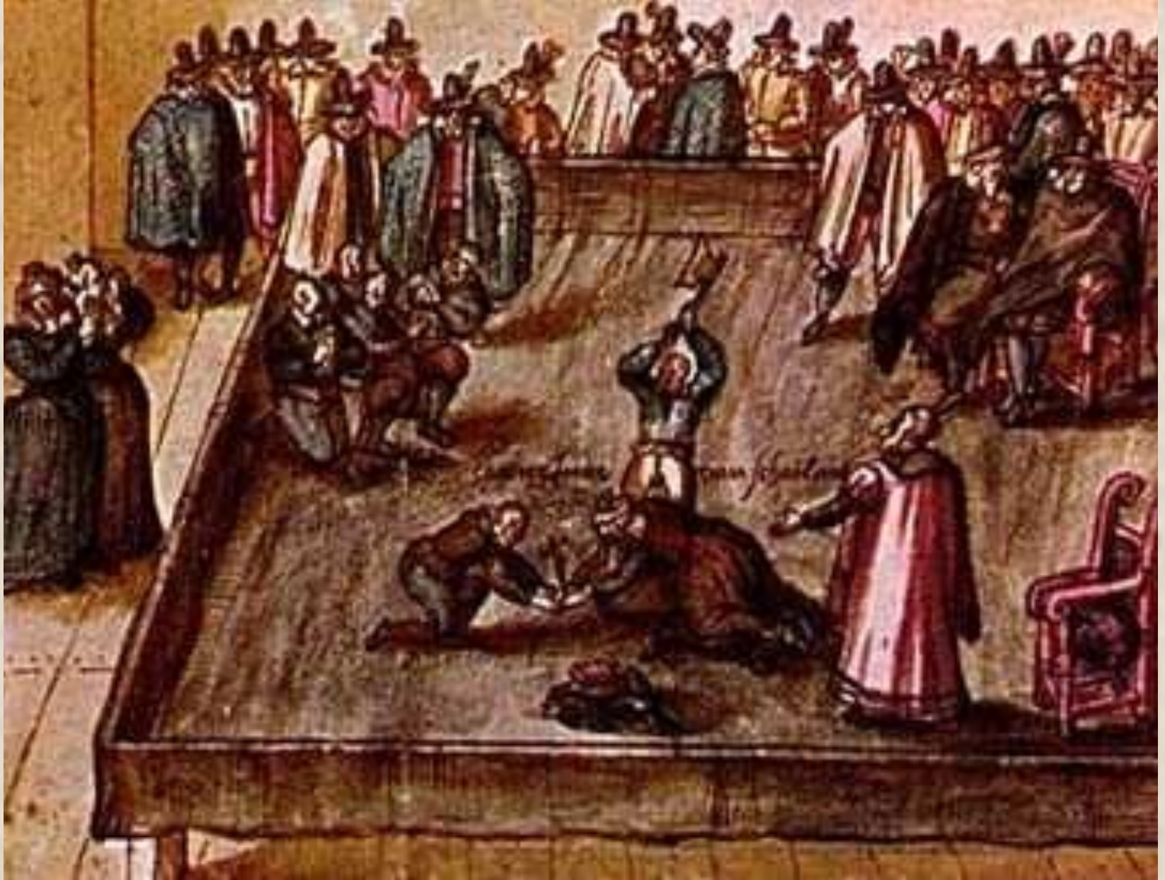
Казнь Марии Стюарт