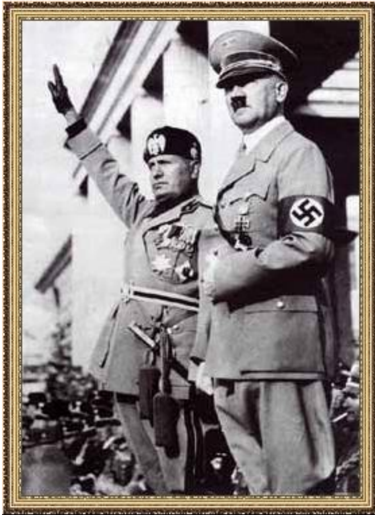
А. Гитлер и Б. Муссолини