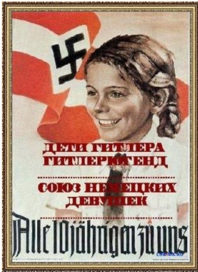
Рекламный плакат Гитлерюгенда