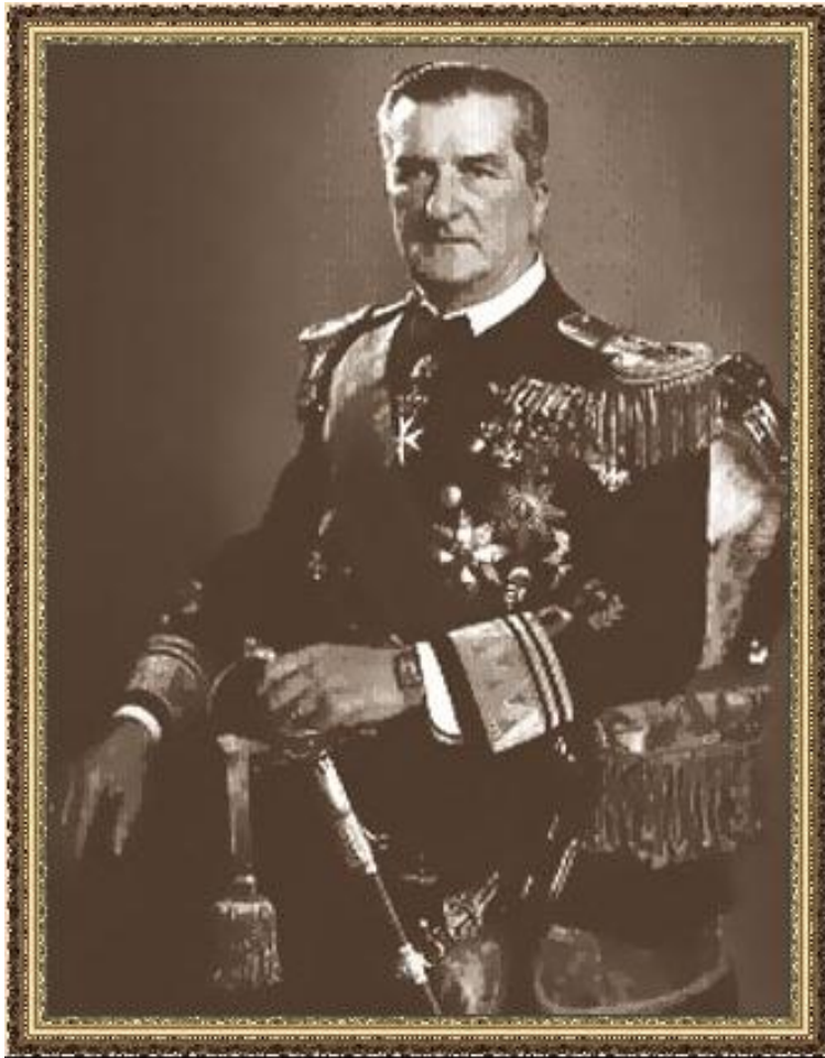
Адмирал М. Хорти.