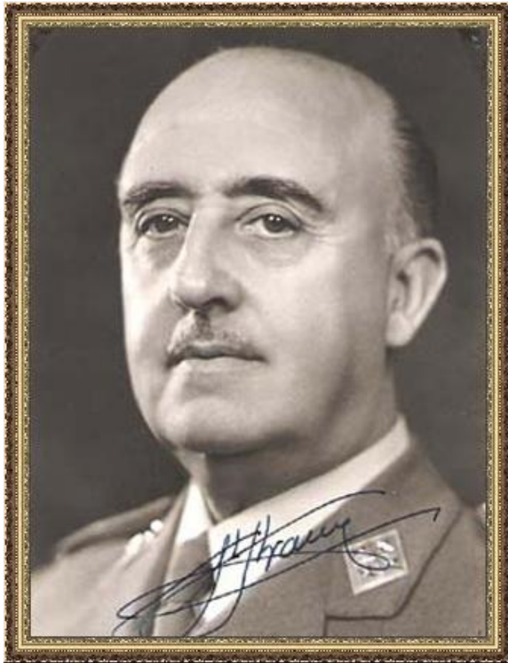
Генерал Ф. Франко