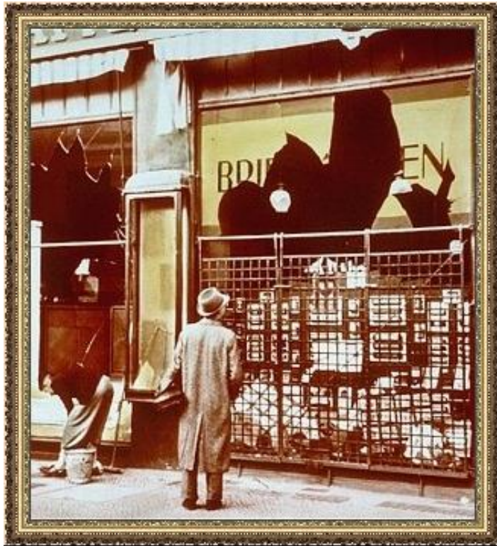
Утро после «Хрустальной ночи»

Запрет инакомыслия. Высылка неудобных. Концентрационные лагеря. Расовые теории. Оккультизм. Арийская раса и «неполноценные».