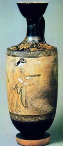
Гетемиды с лебедем. Роспись белофонного сосуда-лекифа. Вазописец Мастер Пана. V в. до н.э.