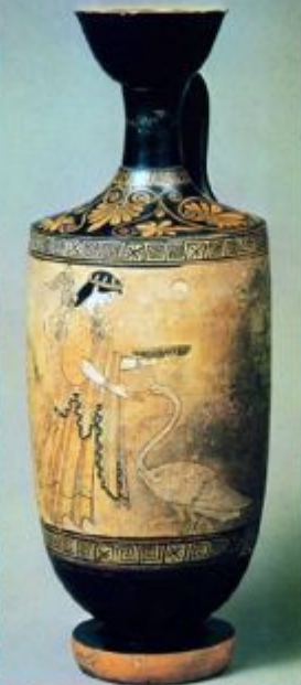
Артемида с лебедем. Роспись белофонного сосуда-лекифа. Вазописец Мастер Пана. V в. до н.э.