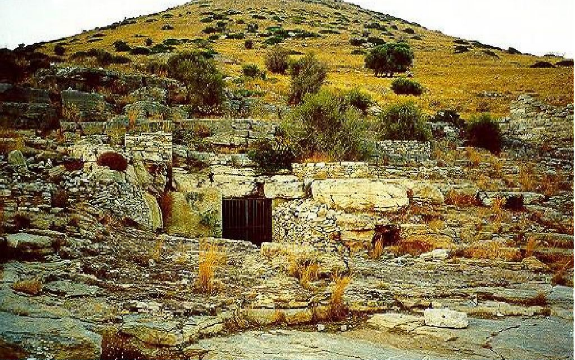
Вход в Лаврийские рудники в Аттике.