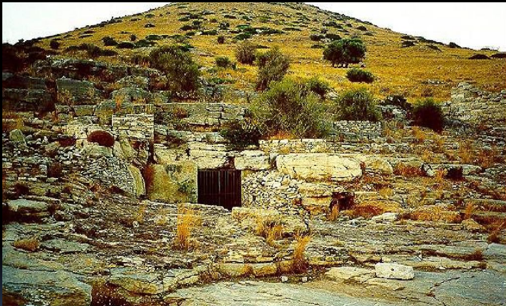
Вход в Лаврийские рудники в Аттике.