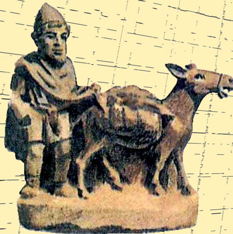
Крестьянин с осликом