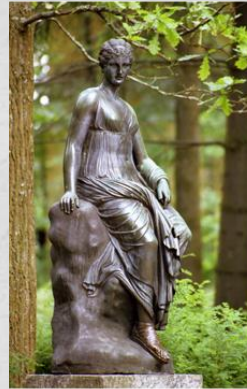
Эвтерпа-муза лирической поэзии