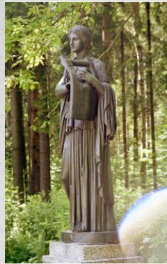
Эрато-муза любвонной поэзии