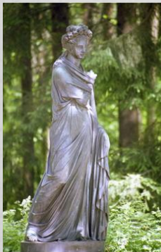
Полигимния-муза пантомимы и гимнов