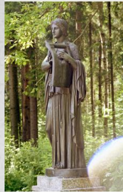
Эрато-муза любвиной поэзии