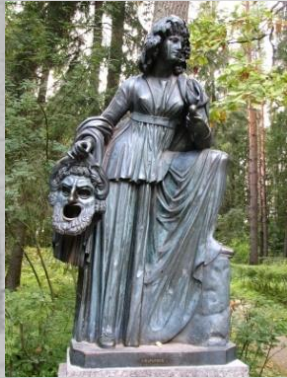
Мельпомена муза трагедии