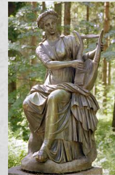
Терпсихора- муза танца