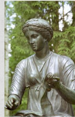
Каллиопа-муза эпической поэзии