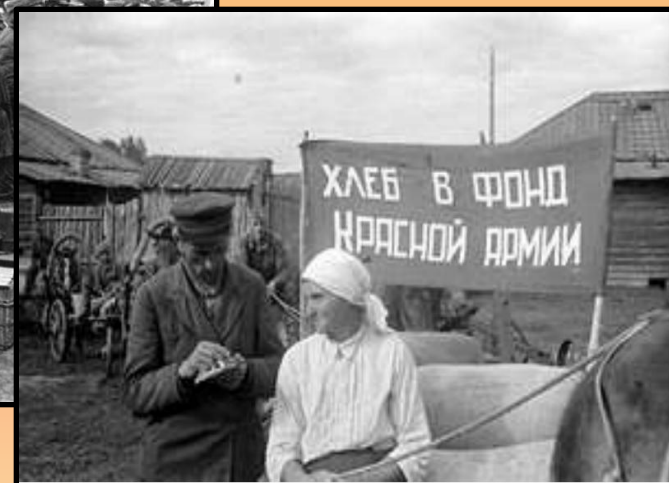
Тыл в годы ВОВ

http://900igr.net/fotografii/istorija/Tyl-v-gody-VOV/008-Tyl-v-gody-VO