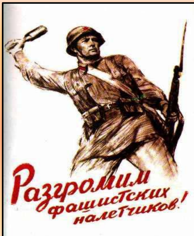
Советские плакаты: Разгромим фашистских захватчиков http://sovmusic.ru/p_view.php?id=83

К лету 1944 года Красная Армия освободила территорию Советского Союза, но война на этом не закончилась. Необходимо было вместе с Францией, Англией США завершить разгром фашистской Германии и её союзников – Италии и Японии.