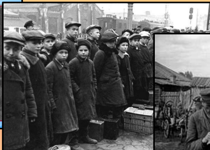
1941-й, дети идут работать на завод

http://900igr.net/kartinki/istorija/Deti-blokady/006-Deti-v-tylu-vmest