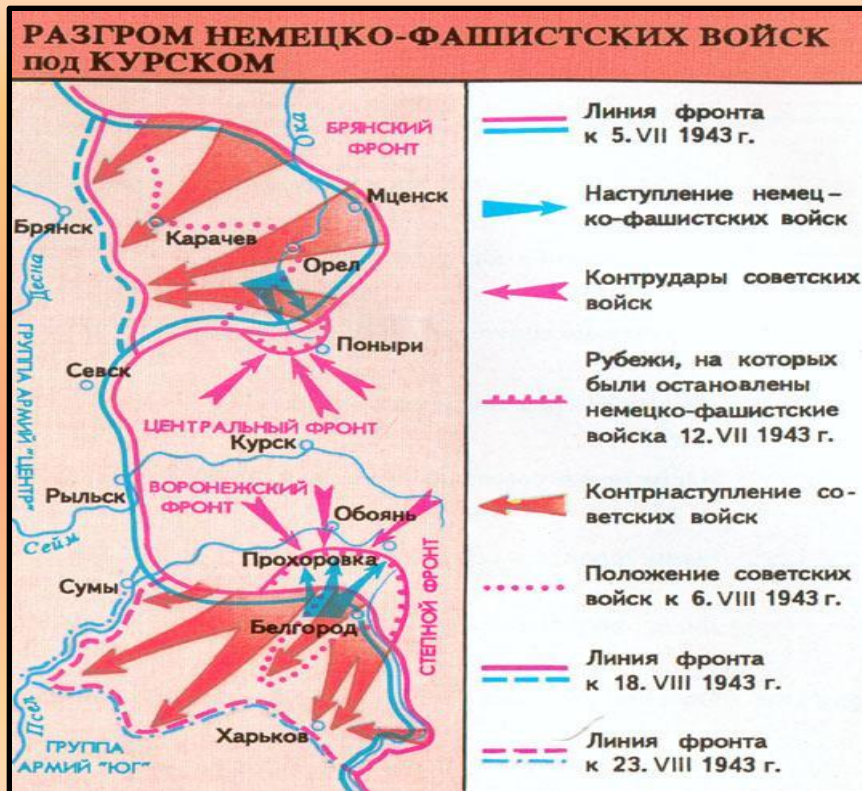
Курская битва (5 июля 1943 - 23 августа 1943)