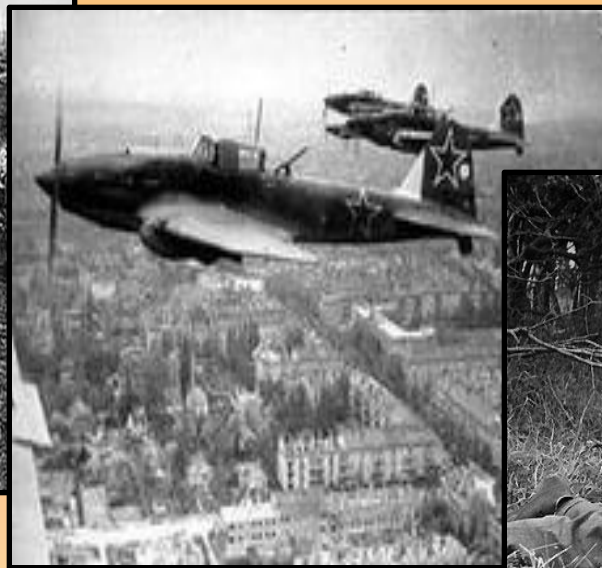
Советская авиация .