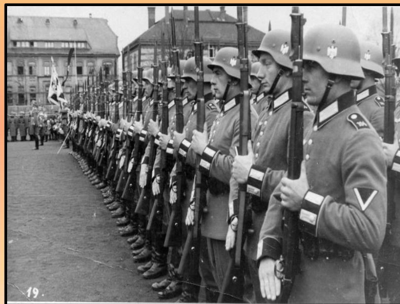
Строй немецких солдат на торжественном построении

http://www.peoples.ru/state/king/germany/hitler/hitler_10_01_02.shtml