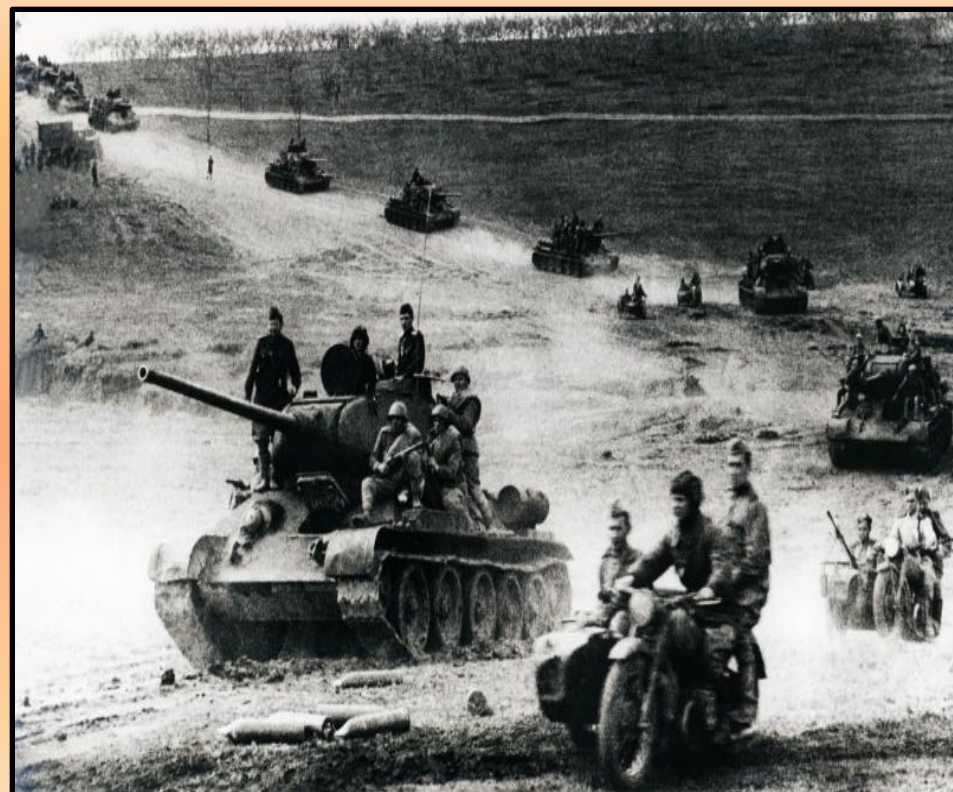
На дорогах войны.