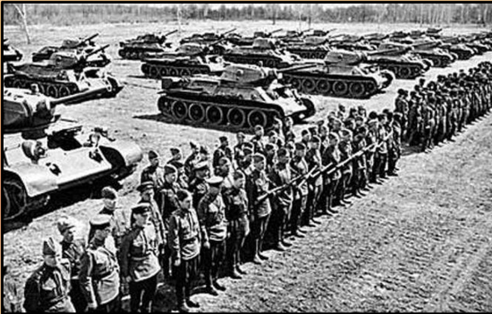
Битва под Москвой

В результате контрнаступления Красной Армии под Москвой в декабре 1941 немцы были отброшены. В битве под Москвой гитлеровская армия впервые потерпела поражение.