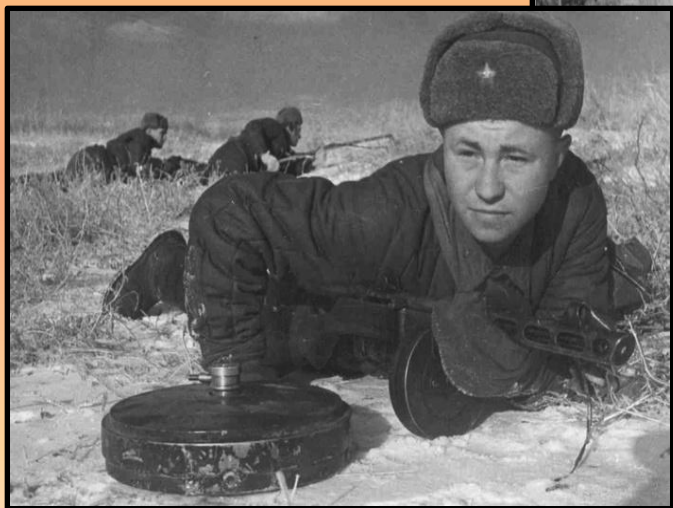
Битва за Сталинград".

Летом 1942 г. началось наступление немецких частей на Сталинград. Несколько месяцев фашисты штурмовали город. Сталинград был превращен в руины, но сражавшиеся за каждый дом советские солдаты выстояли и перешли в наступление. Зимой 1942-1943 г. в войне наступил перелом.