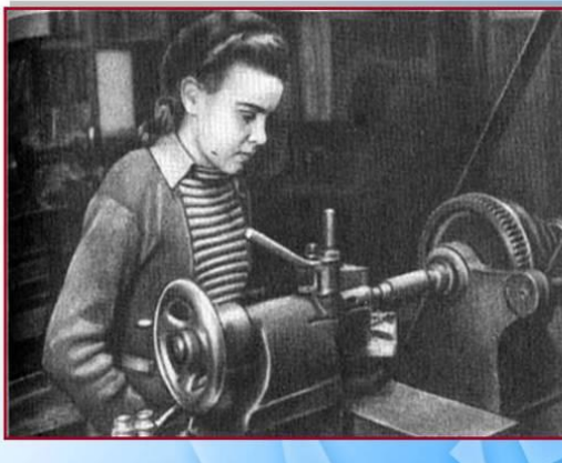
Дети в тылу: вместо отцов.

http://900igr.net/kartinki/istorija/Deti-blokady/006-Deti-v-tylu-vmest