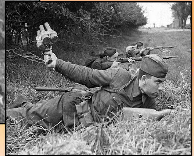
На поле боя