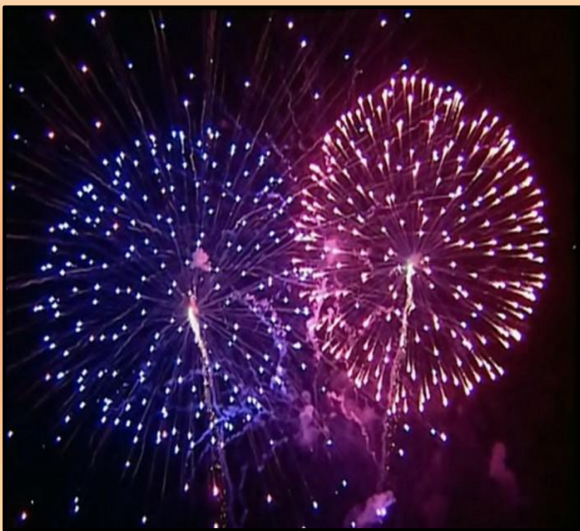
Салют в День Победы

Ежегодно 9 мая в небе над Россией расцветают праздничные салюты в честь великой победы над фашизмом. В День Победы 9 мая мы вспоминаем с благодарностью всех павших и выстоявших в Великой Отечественной войне. Минутой молчания мы чтим всех, кто отстоял нашу Родину.