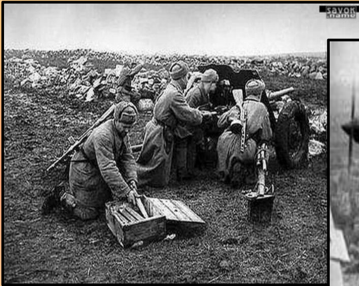
на поле боя

В течение года после нападения Германии на СССР, немецкая армия смогла завоевать значительные территории, в число которых входили Литва, Латвия, Эстония, Молдавия, Белоруссия и Украина. После этого войска двинулись вглубь страны с целью захватить Москву и Ленинград.