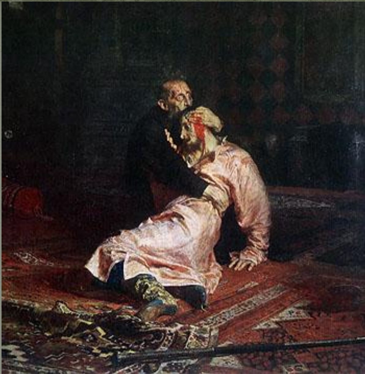
И. Репин Иван Грозный и сын его Иван