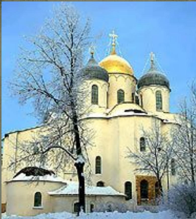
Храм Святой Софии