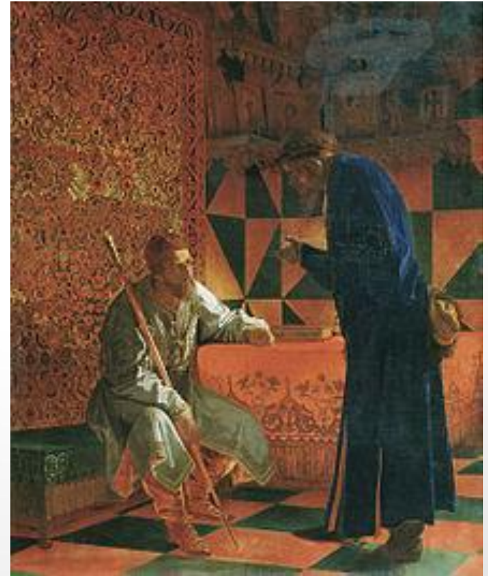
Иван Грозный и Малюта Скуратов В.Г. Седов

Эти поражения были закономерностью проводимой в стране повсеместно опричниной. В 1572 г. опричнина была отменена.