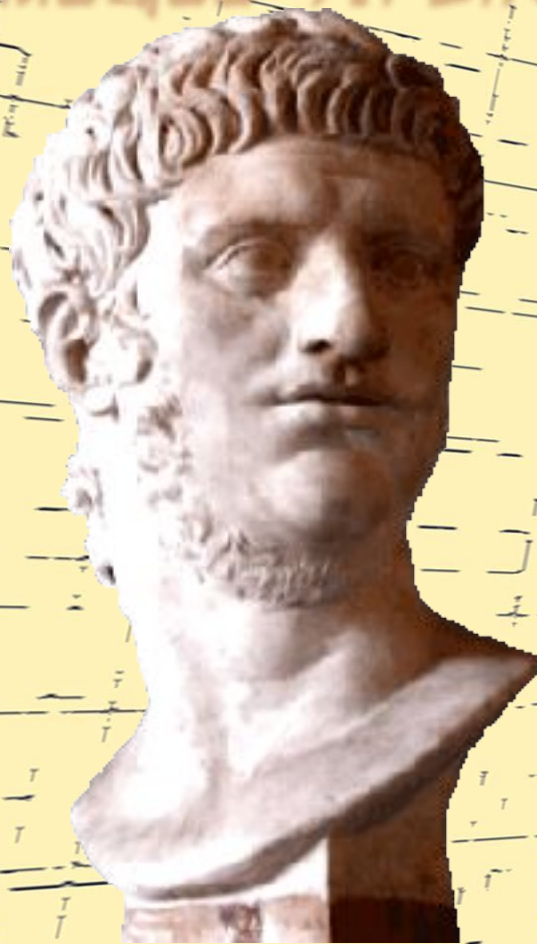
Нерон (54-68 гг.)