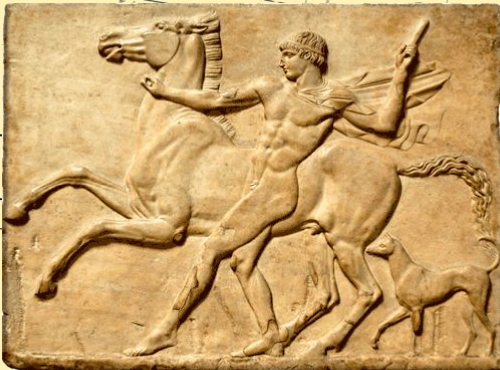
Юноша с конём (барельеф)