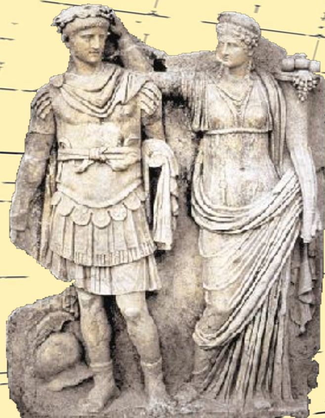
Нерон и Агриппина