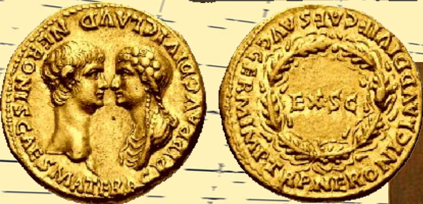
Золотая монета с изображением Нерона и Агриппины