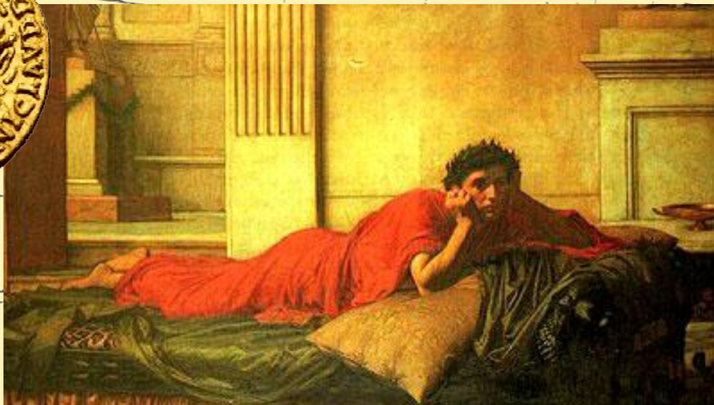
Джон Уильям Уотерхауз. Нерон мучается от угрызений совести после убийства матери (1878 г.)