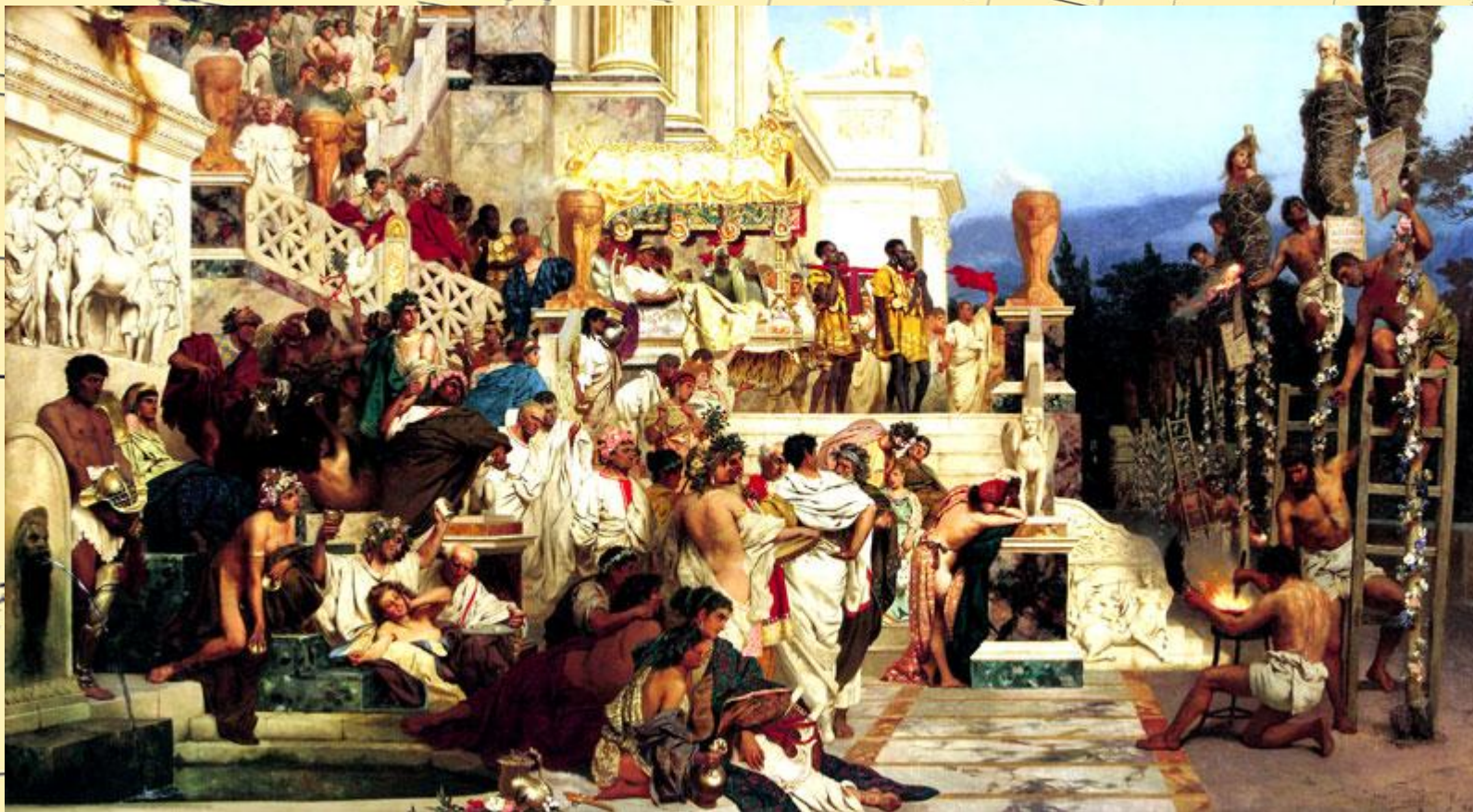
Генрих Семирадский. Светочи христианства (Факелы Нерона). (1882 год).