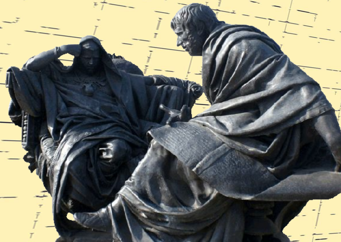
Нерон и Сенека, памятник в Кордобе, Испания. Скульптор: Эдуардо Баррон.