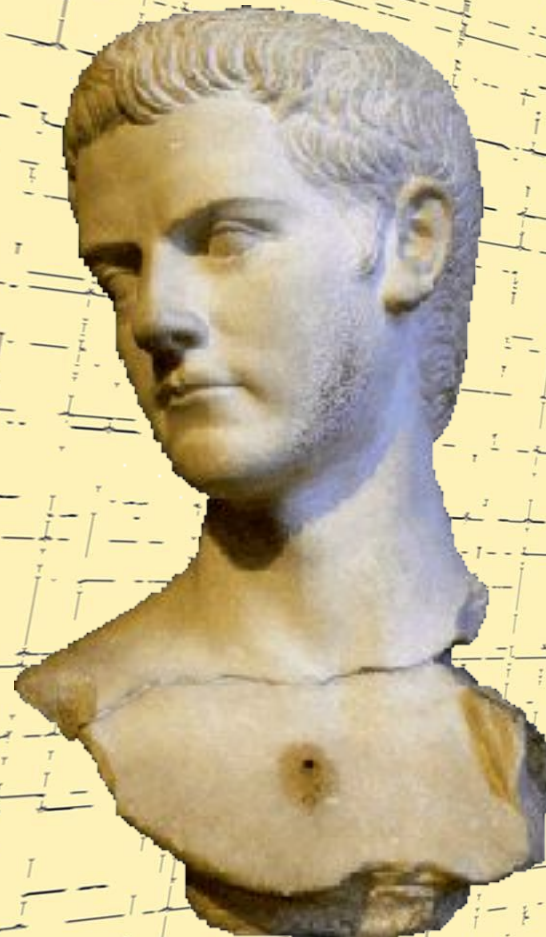
Калигула (Лувр) (37-41 гг.)