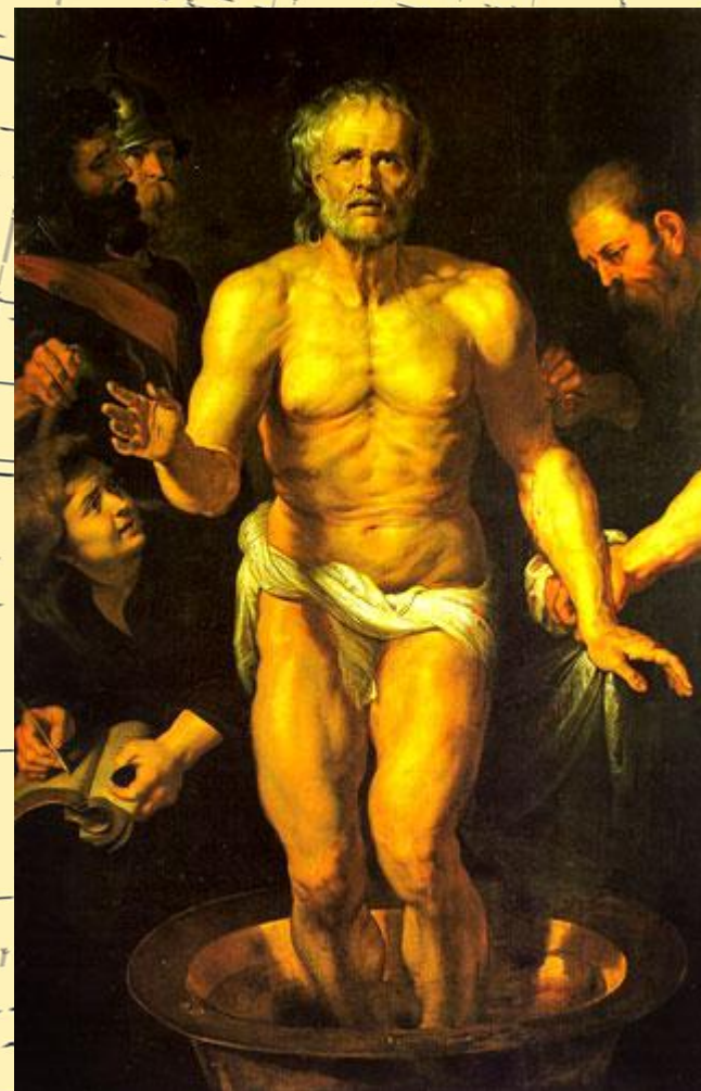
Рубенс. Смерть Сенеки.