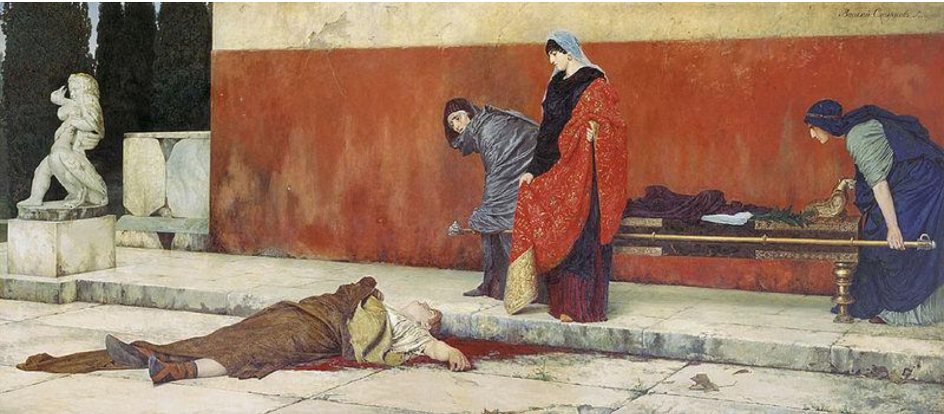
Смерть Нерона (Смирнов В.С., 1888.)