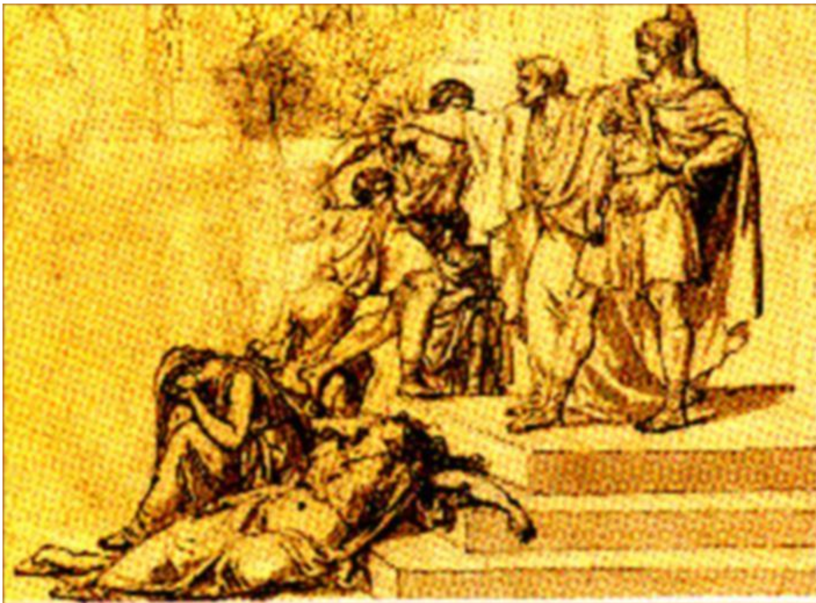
Убийство Нерона. Рисунок 17 века