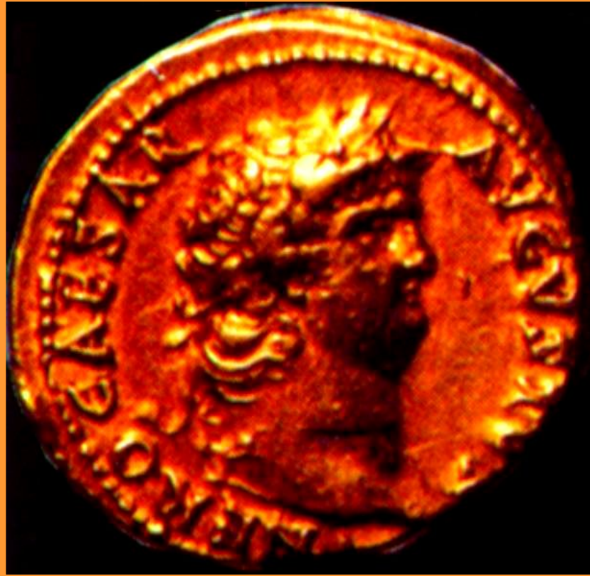
Древнеримская монета с изображением Нерона

В 1 в.н.э. Римская импе-рия достигла вершины своего могущества.