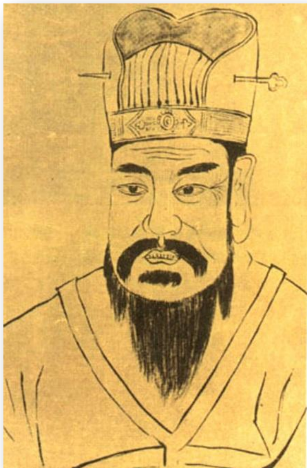
Ван Ман 王莽 (45 до н. э. — 23 гг. н.э.) китайский император в 9—23 гг.