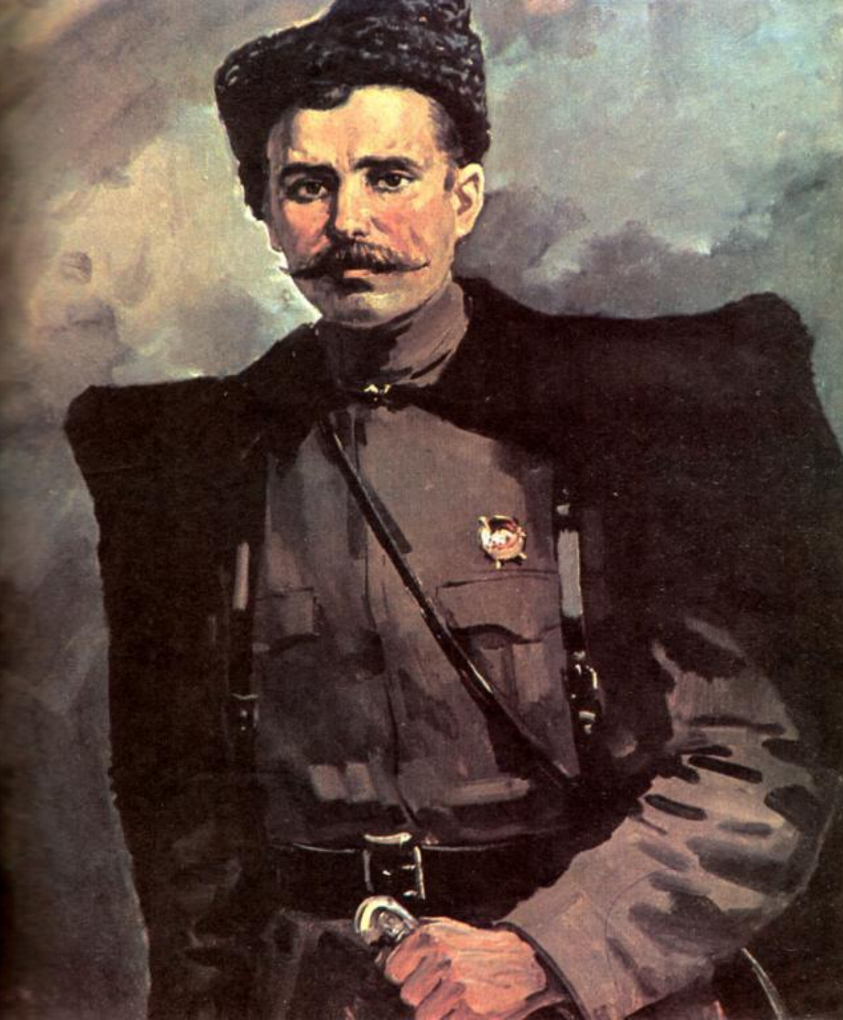
Василий Иванович Чапаев (1887-1919)