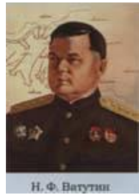
Н. Ф. Ватутин