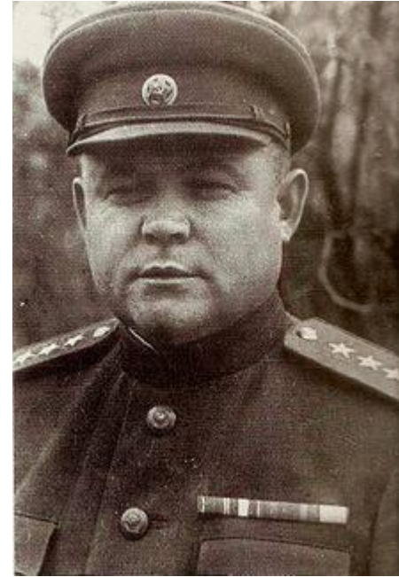
Генерал армии Н. Ф. Ватутин, 1943г.