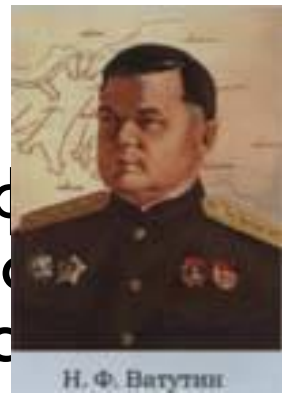
Н. Ф. Ватутин

Добиваться осуществления этих противоречивых целей предстояло в тяжелых условиях северного климата и болотистого рельефа. Две горькие шутки были сложены офицерами Северо-Западного фронта: "местность где господь забыл разделить небо и землю; место куда посылают за непослушание родителям".