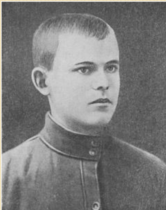
Н.Ф.Ватутин. 1929 г.