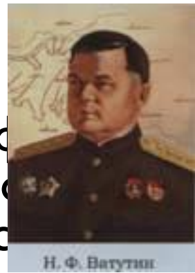
Н. Ф. Ватутин

Добиваться осуществления этих противоречивых целей предстояло в тяжелых условиях северного климата и болотистого рельефа. Две горькие шутки были сложены офицерами Северо-Западного фронта: "местность где господь забыл разделить небо и землю; место куда посылают за непослушание родителям".