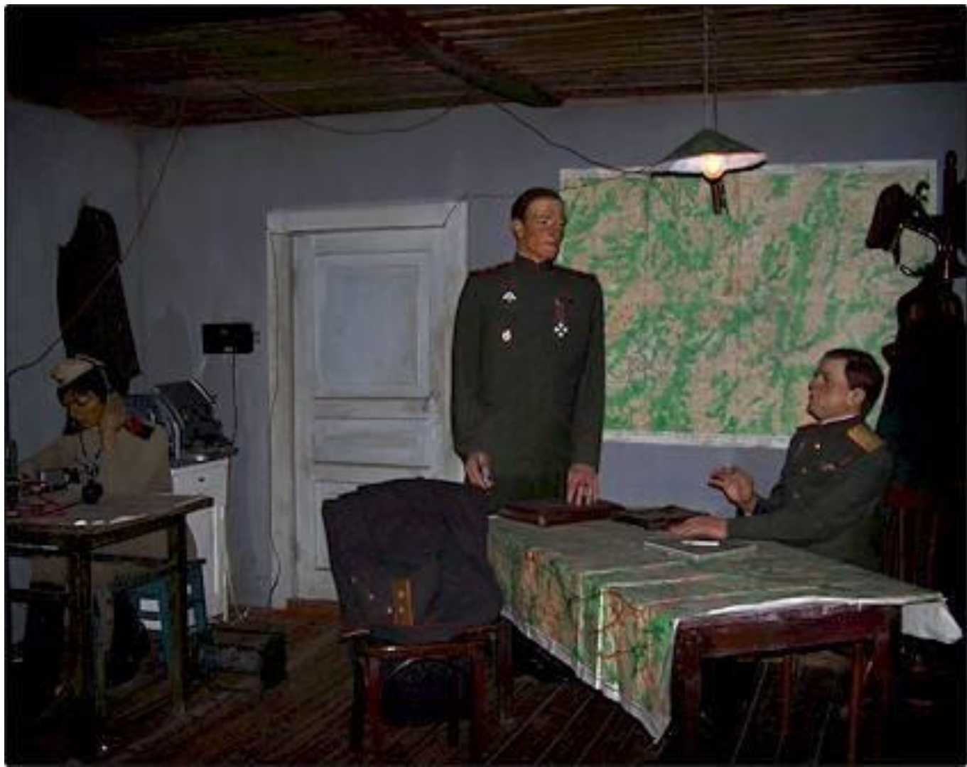
Встреча в штабе Воронежского фронта генерала армии Ватутина Н.Ф., командующего Воронежским фронтом и генерал-лейтенанта Катукова М.Е., командующего I танковой армией перед Курской битвой. Лето 1943. Белгородская диорама