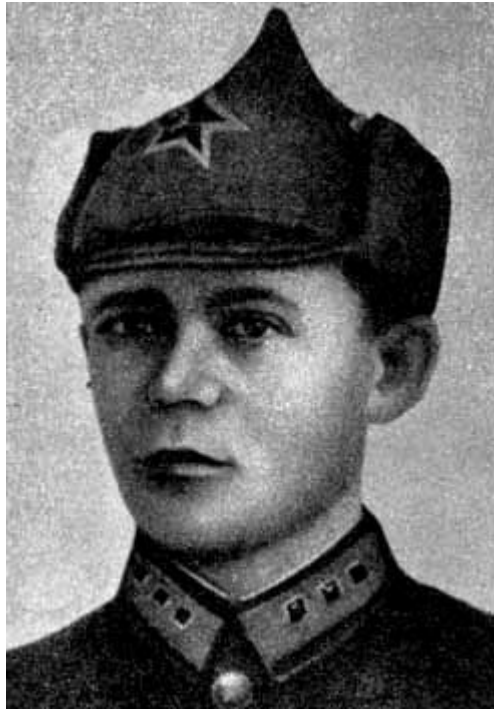
Н. Ватутин в 16 лет