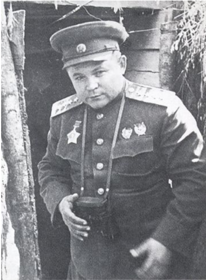
Генерал армии Н.Ф. Ватутин