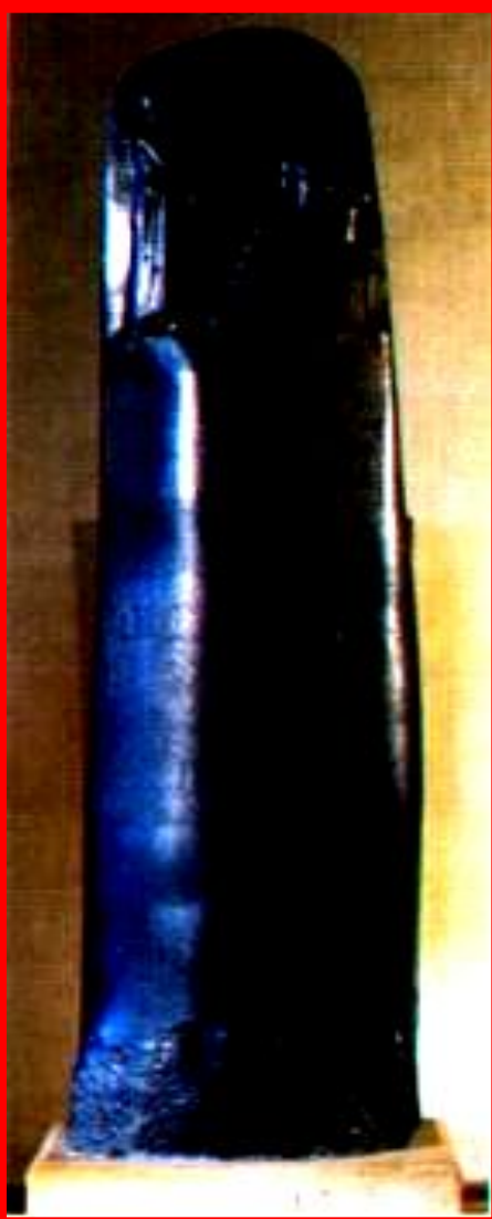
Стелла с законами Хаммурапи из Суз.