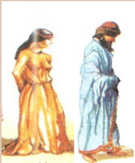
Человек, укрававший одежду богини Иштар из храма