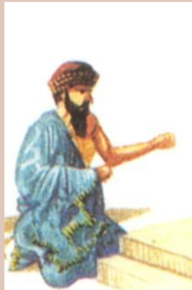
Человек убивший вола