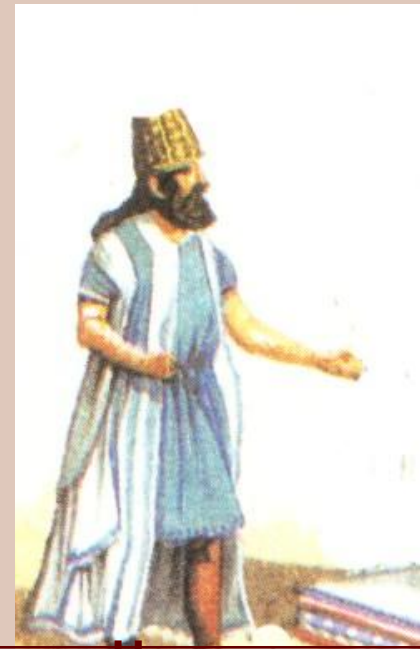
Человек, укрававший беглого раба