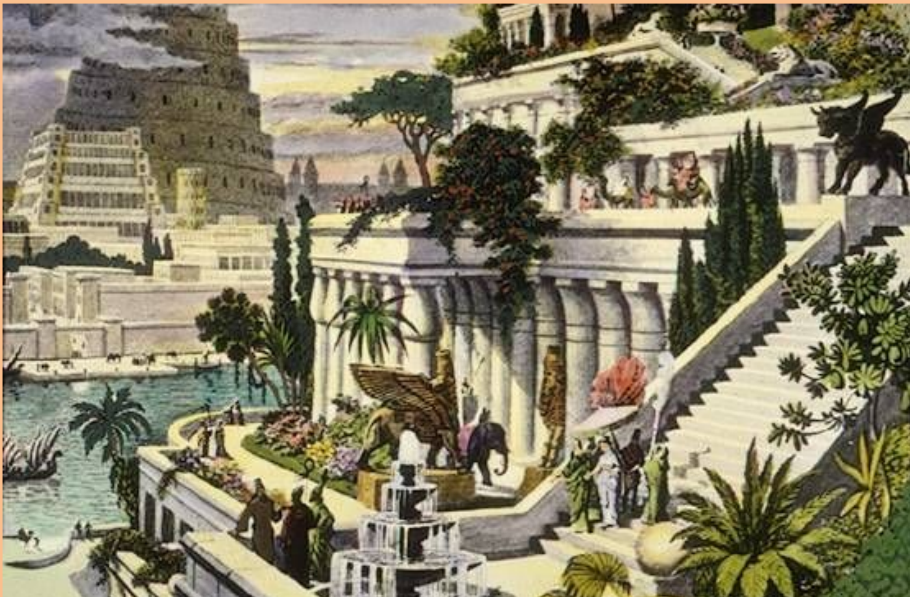
Висячие сады царицы Семирамиды, жены царя Навуходоносора