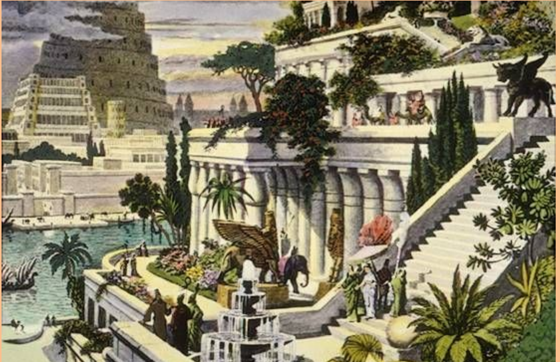
Висячие сады царицы Семирамиды, жены царя Навуходоносора