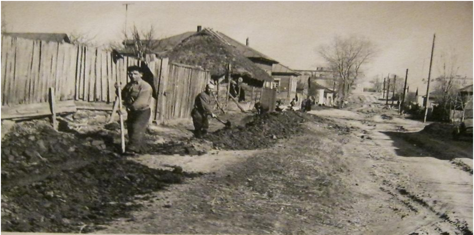
На комуністическом субботнике

Районний комітет партії, міська Рада Депутатів організовували трудящих на відбудову міста. У вільний від роботи час робітники й службовці виходили на відбудову.