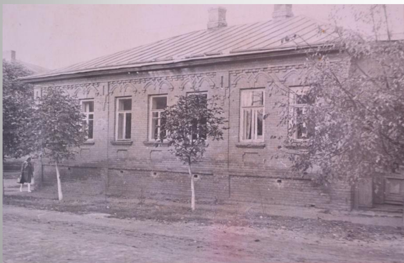
Приміщення школи в 1943 році

У 1944 році 7 випускниць завершили здобуття середньої освіти, перерване війною. Їх ровесники хлопці ще були на фронтах війни.