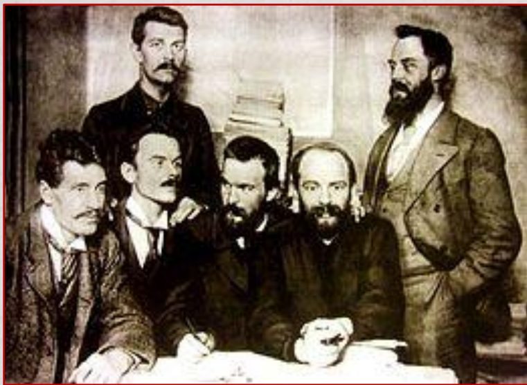
Члени Польської соціалістичної партії