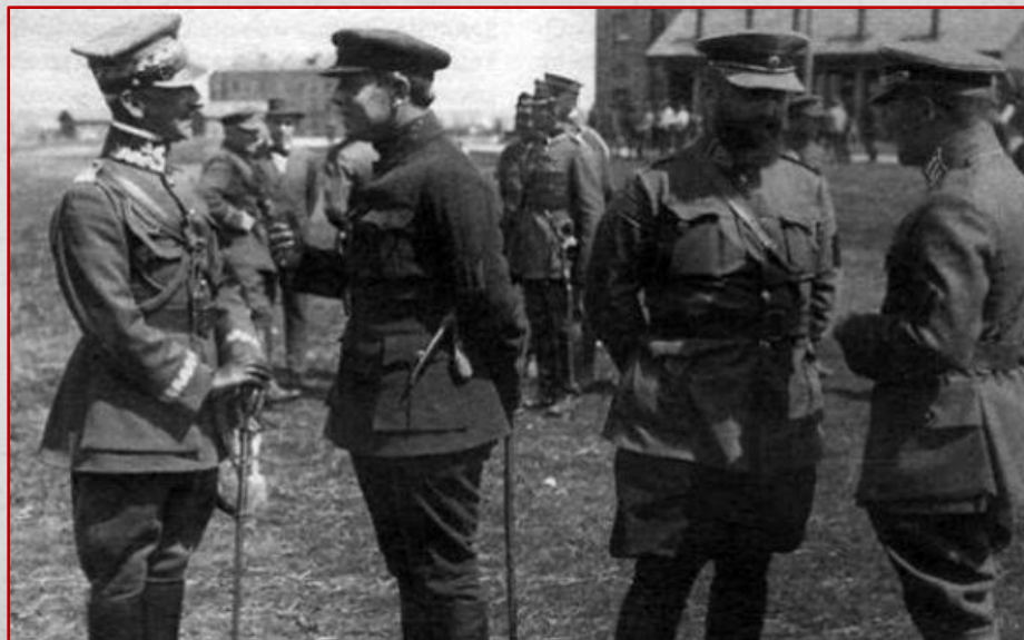
Юзеф Пілсудський і Симон Петлюра