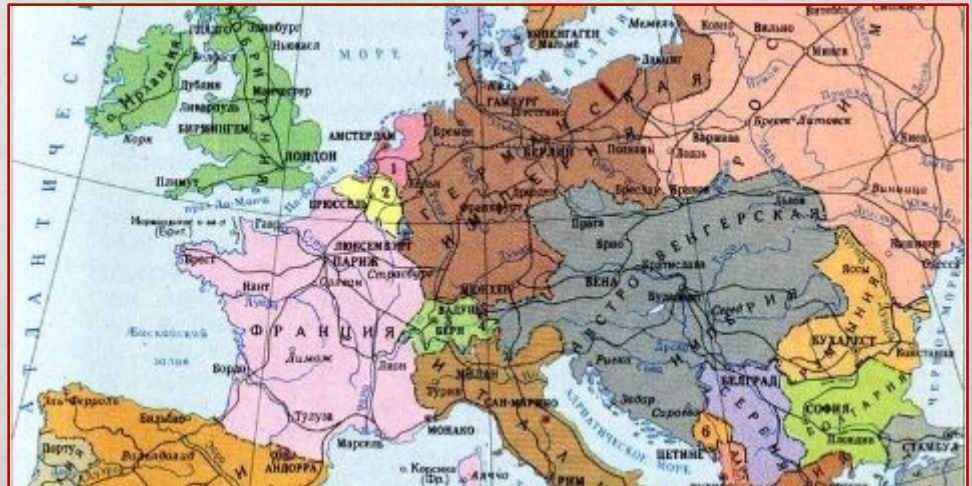
Землі Польщі станом на 1914 р.