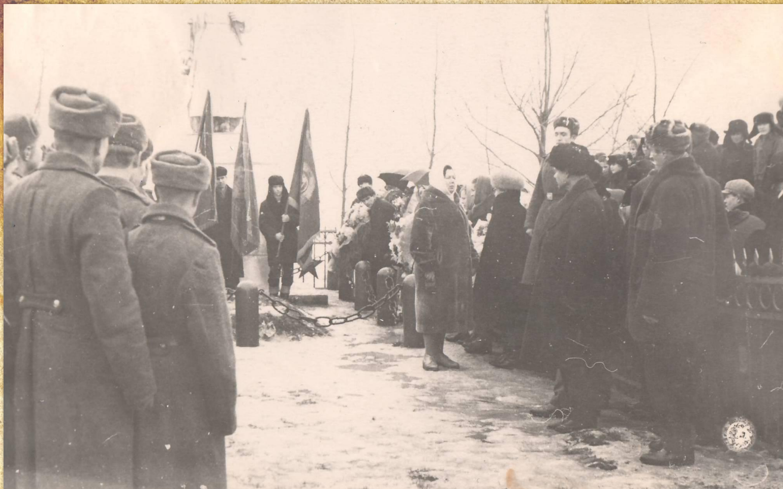
Открытие траурного митинга