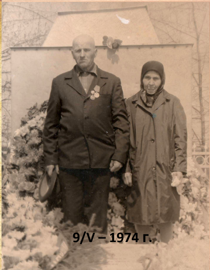
9/V - 1974 г.

Индекс предприятия связи места назначения