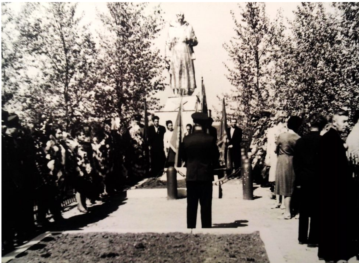
Торжественно-траурный митинг в честь Дня Победы (1967г.)