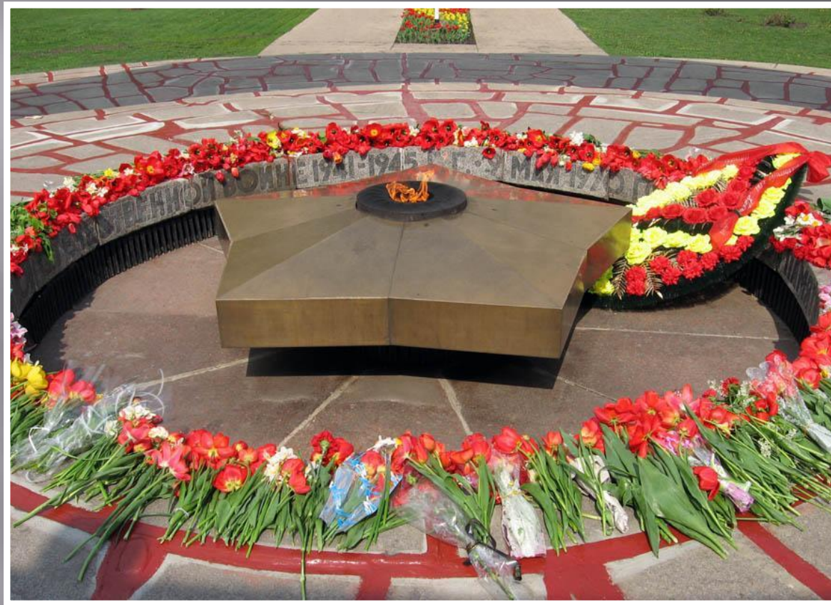
Звезда в центре монумента

В самом центре монумента находится звезда вылитая из бронзы, служащая основанием для "Вечного огня". На граните по периметру сделана надпись: «Светлой памяти тамбовцев, отдавших жизнь за нашу Родину в Великой Отечественной войне 1941 - 1945 гг. 9 мая 1970 г.». Символичность и значимость данного памятника трудно переоценить.