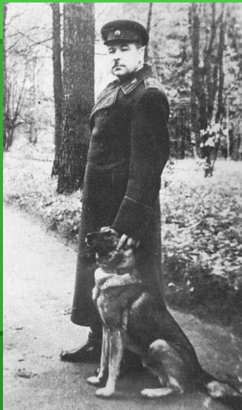
■ Л.А.Говоров и его верный друг.