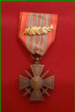
Военный Крест (Франция)