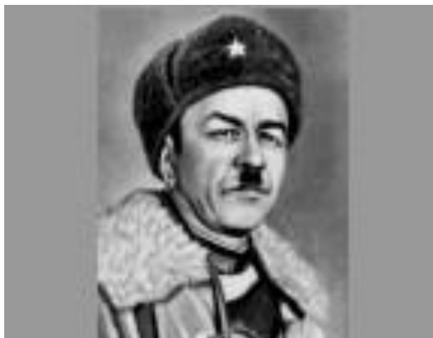
генерал Панфилов И.В.

16 ноября 1941 года совершили подвиг герои панфиловцы. Важнейшим событием первого года Великой Отечественной войны стала историческая битва под Москвой. Гитлеровское командование делало особую ставку на захват столицы нашей Родины. На подступах к Москве были сосредоточены главные силы немецко-фашистской армии. Однако превосходство противника и в живой силе и в технике не сломило боевого духа защитников столицы. Москва превратилась в несокрушимую крепость. Ощетинившись поясами оборонительных укреплений, суровая и грозная, Москва работала, ковала победу, снабжала фронт всем необходимым. Десятки тысяч москвичей вступили в народное ополчение, ушли в партизанские отряды.