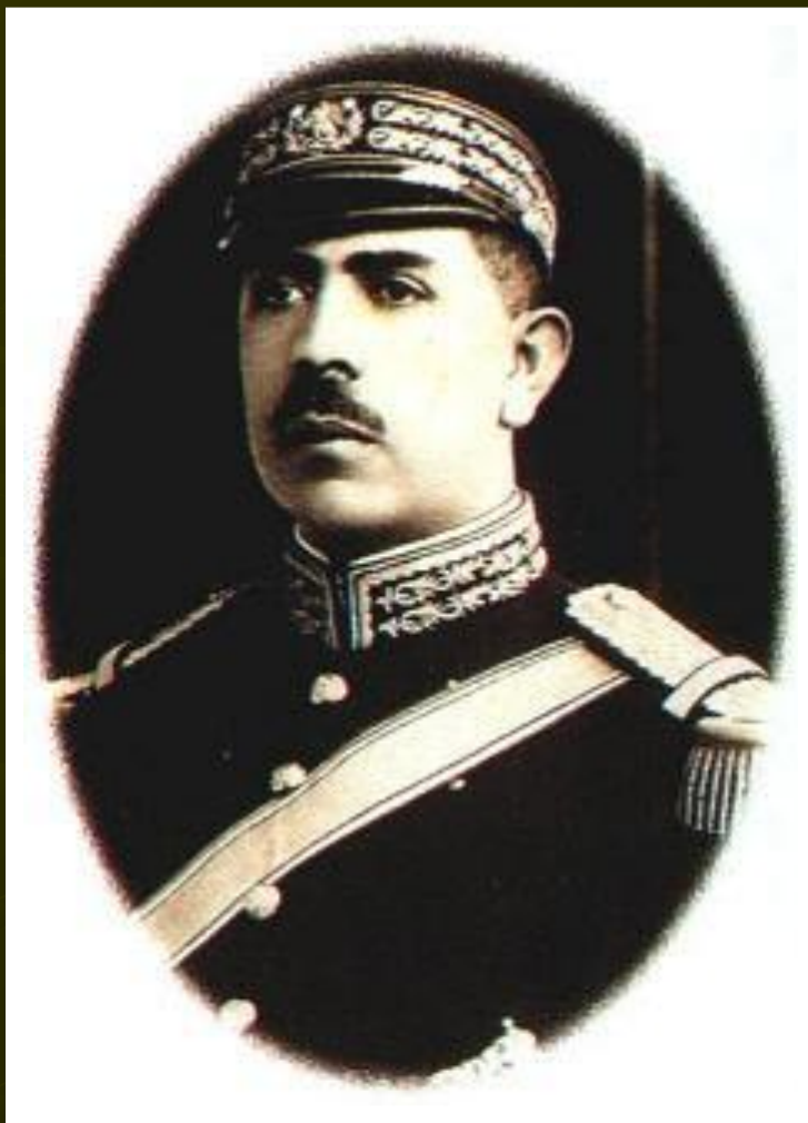
Ласаро Карденас Президент Мексики

В Великобритании 2-ы к власти приходили лейбористы, но преодолеть трудности они не смогли и в сер. 30-х гг. к власти возвратились консерваторы.