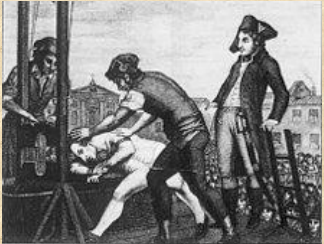
Казнь Максимилиана Робеспьера (10 термидора II года) 28 июля 1794