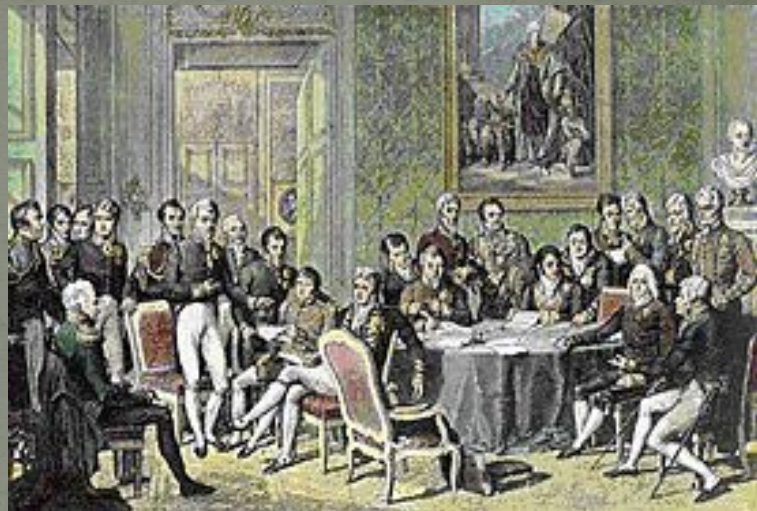
Участники Венского конгресса

1814—1815 гг. — общеевропейская конференция, в ходе которой была выработана система договоров, направленных на восстановление феодально-абсолютистских монархий, разрушенных французской революцией 1789 года и наполеоновскими войнами, и были определены новые границы государств Европы. В конгрессе, проходившем в Вене с сентября 1814 по июнь 1815 г. под председательством австрийского дипломата графа Меттерниха, участвовали представители всех стран Европы (кроме Османской империи). Переговоры проходили в условиях тайного и явного соперничества, интриг и закулисных сговоров.